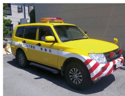
道路管理パトロール車