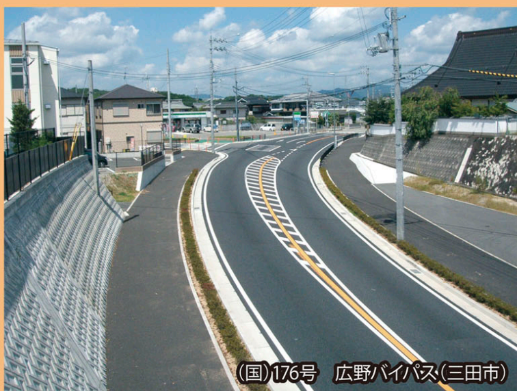
(国)176号 広野バイパス(三田市)