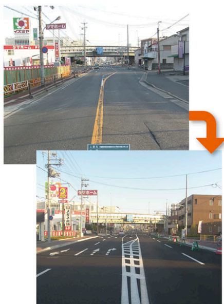
街路事業 (都)尼崎宝塚線(伊丹市山田)

生活に密着した一般道路の整備や交通が集中する都市部の街路網の整備を進めるとともに、道路の耐震化、低騒音舗装、電線類地中化等の推進及び道路管理パトロール等による道路の維持管理を行っています。