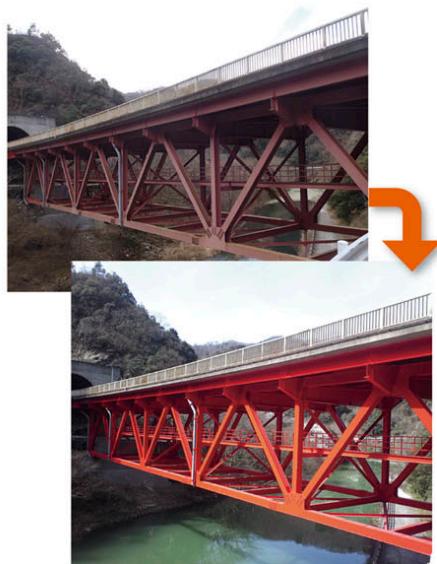
橋梁補修耐震化(龍化橋) (国)173号(猪名川町民田)