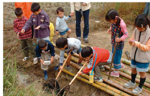
棚田の生き物保全棚田救い

有馬富士公園では、「みんなでつくるふるさと公園」をテーマに、地域住民の方に「ゲスト（公園利用者）」ではなく「ホスト（運営者）」として、来園者向けのイベント活動を企画・運営してもらう等、地域の活動団体と連携した「夢プログラム」の取り組みを行っています。