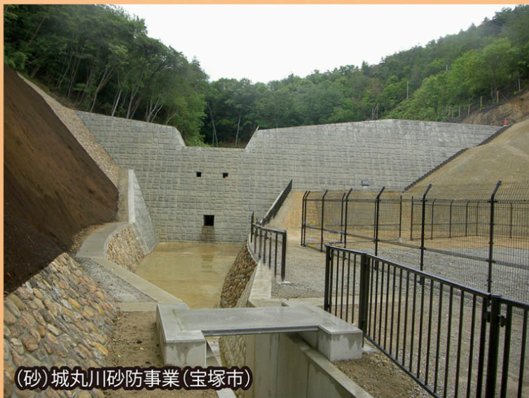
(砂)城丸川砂防事業(宝塚市)