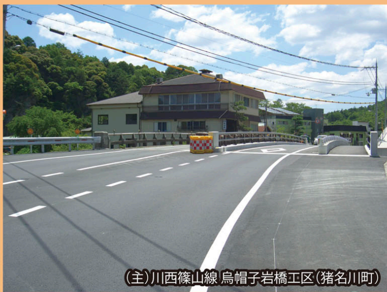
(主)川西篠山線 烏帽子岩橋工区(猪名川町)