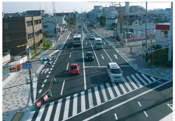
昆陽里交差点（伊丹市山田）

阪神南北道路をはじめとする幹線道路網の整備を促進することにより、交通渋滞の緩和や安全で快適な都市空間の確保、優れた景観の形成、また災害時における避難、救援・救急活動、緊急物資輸送等の迅速化を図っています。