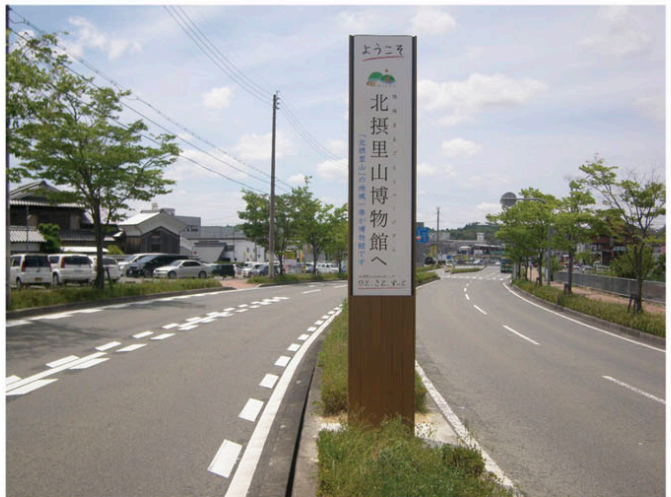
新三田駅東 ウェルカムサイン