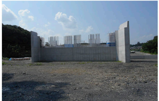
(仮称)一庫大路次川橋A2橋台

http://web.pref.hyogo.lg.jp/hnk09/zigyou.html