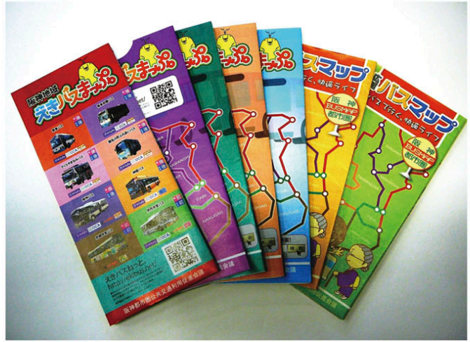
「阪神地域えきバスまっぷ。」

公共交通に関する取組としては、普段バスを利用しない人にも、路線バスの便利さや阪神地域の魅力を知って頂くことを目的として、公共交通機関を利用して観光スポットを巡るポイントラリーイベント「バスでエコー！」を実施します。