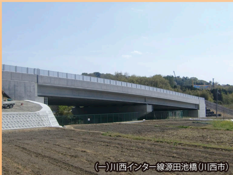
(一)川西インター線源田池橋(川西市)