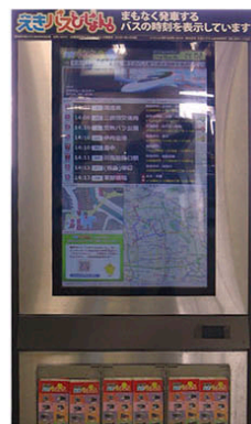
えきバスびじょん。