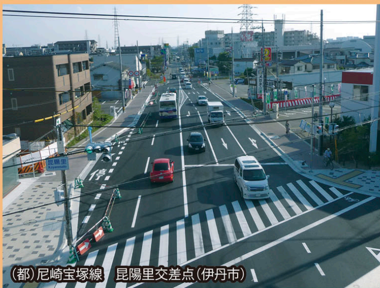
(都)尼崎宝塚線 昆陽里交差点(伊丹市)