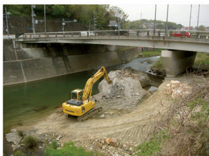
(一)猪名川河川改修事業(川西市鼓が滝)

河川砂防課では、伊丹市、宝塚市、川西市、猪名川町の河川・砂防事業を担当し、調査・設計、工事発注・監理などを行っており、武庫川・猪名川などの河川改修事業、砂防事業や急傾斜地崩壊対策事業、河川・砂防施設の維持修繕工事に取り組んでいます。