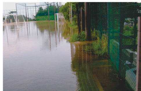
(二) 武庫川水系流域貯留浸透事業 (宝塚東高校)

猪名川流域は都市化が進んでおり、洪水などに備えて減災対策に着手に取り組む必要があり、県民が安全で安心して暮らせる生活環境の確保を目指して、治水対策を継続して推進します。また、猪名川の県管理区間では、河川法に基づく河川整備計画の策定に取り組みます。