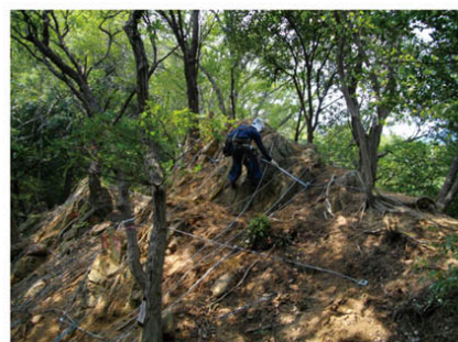
六甲山系グリーンベルト整備事業