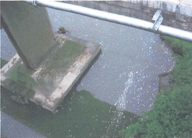
亀治橋 (2007. 5. 28)