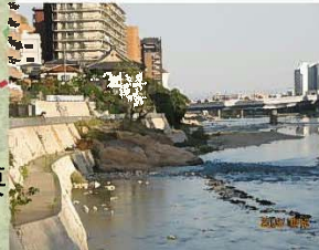
けなげに生きる樹木と岩の 路頭