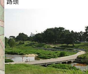
仁川合流点付近下流右岸