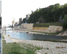
災害復旧工事の護岸景観