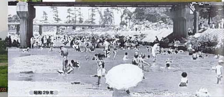
S29年ごろの武庫川下流

河川管理者 都市の河川部局 都市部局等 の連携協働的取組が重要 武庫川を中心とした 県・市の連携・協働的取組が重要 + 地域住民の参画と連携・協働