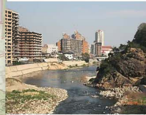
見返り岩と宝塚中心