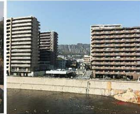
マンションの林立