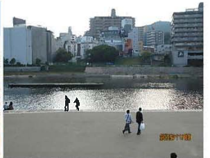
日陰のない高水敷と対岸の 錯綜した都市景観景観