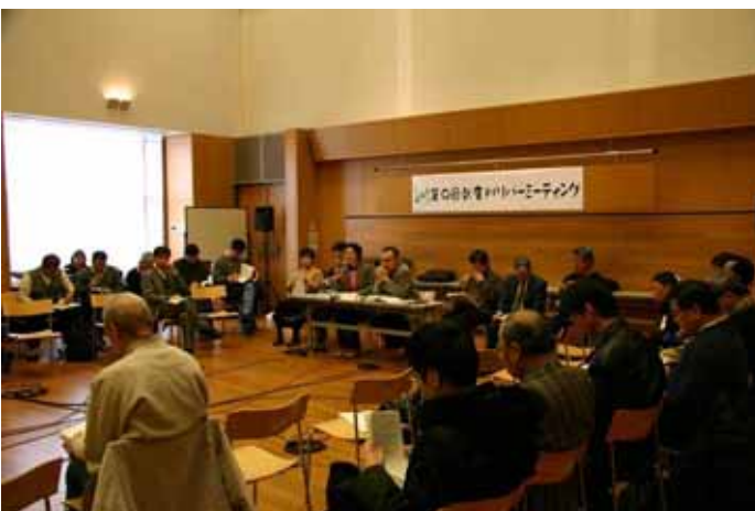
第9回 リバーミーティング