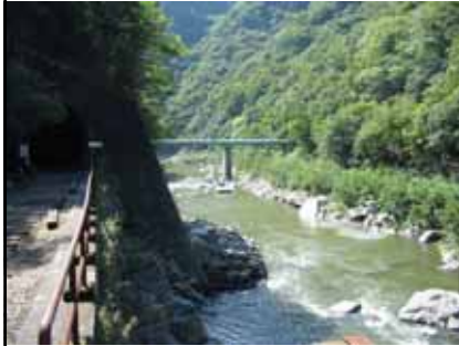
神戸市水道 水管橋