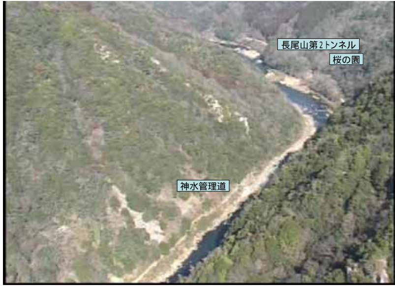
武庫川下流 0:19:12 No.1-42