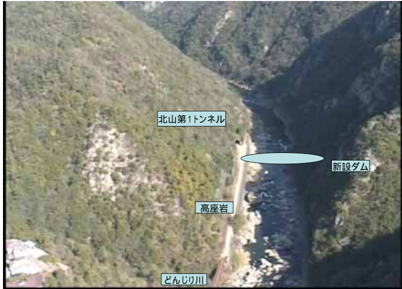
武庫川下流 0:16:27 No.1-30