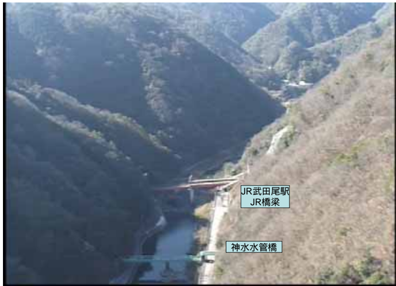
武庫川下流 0:20:54 No.1-49