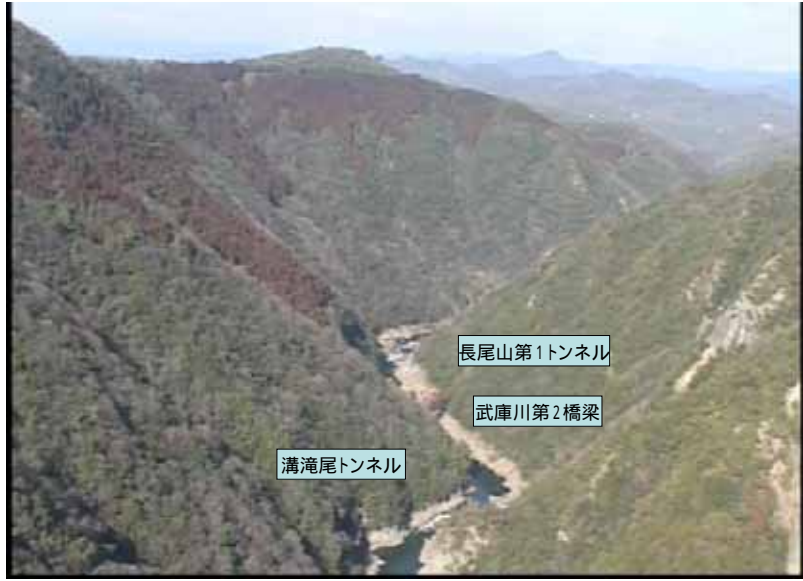
武庫川下流 0:18:30 No.1-38