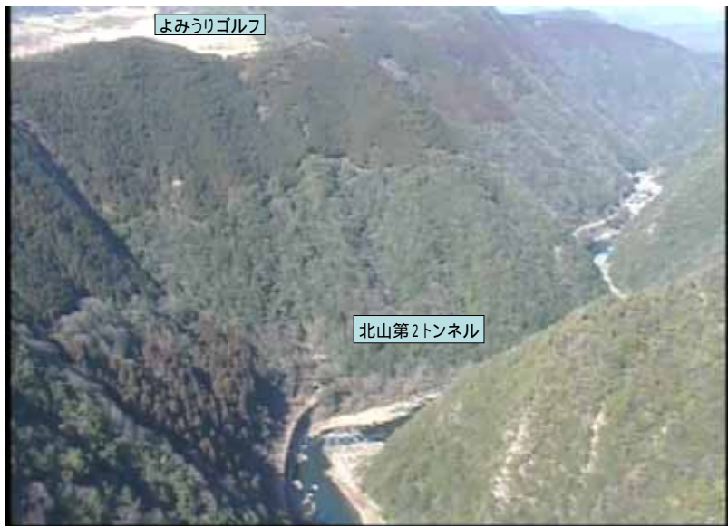
武庫川下流 0:17:23 No.1-34