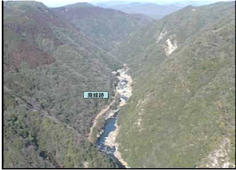
武庫川下流 0:17:54 No.1-36