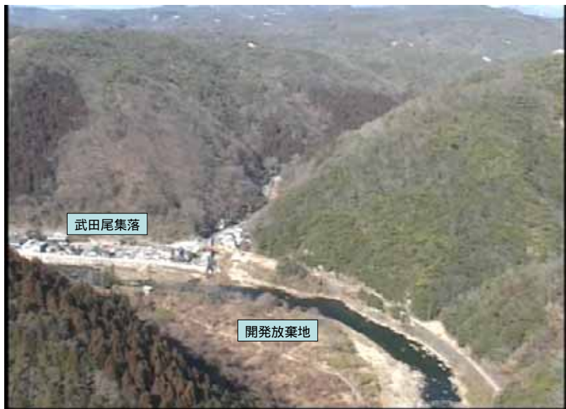
武庫川下流 0:20:02 No.1-46