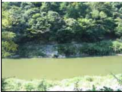
桜の園前 親水広場