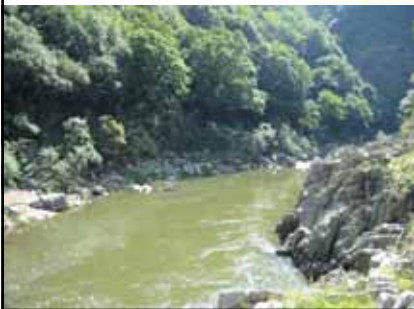
北山第1 トンネル出口