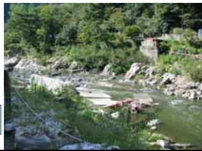
武田尾橋 吊橋(流失)