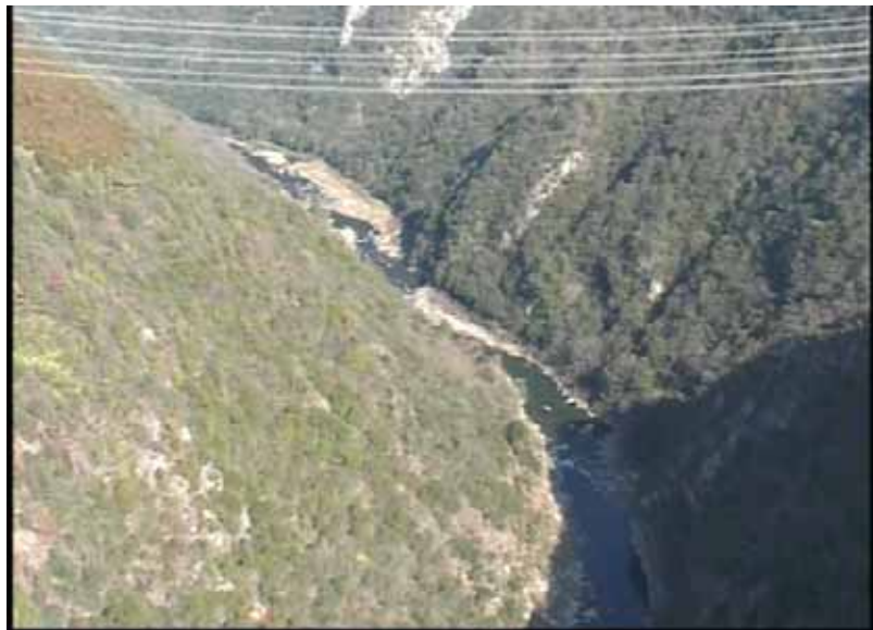
武庫川下流 0:16:40 No.1-31