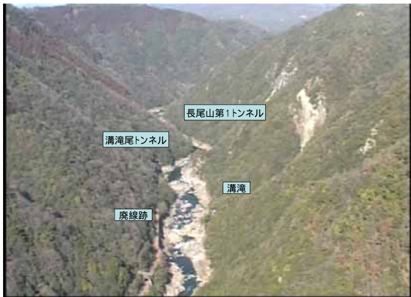
武庫川下流 0:18:16 No.1-37