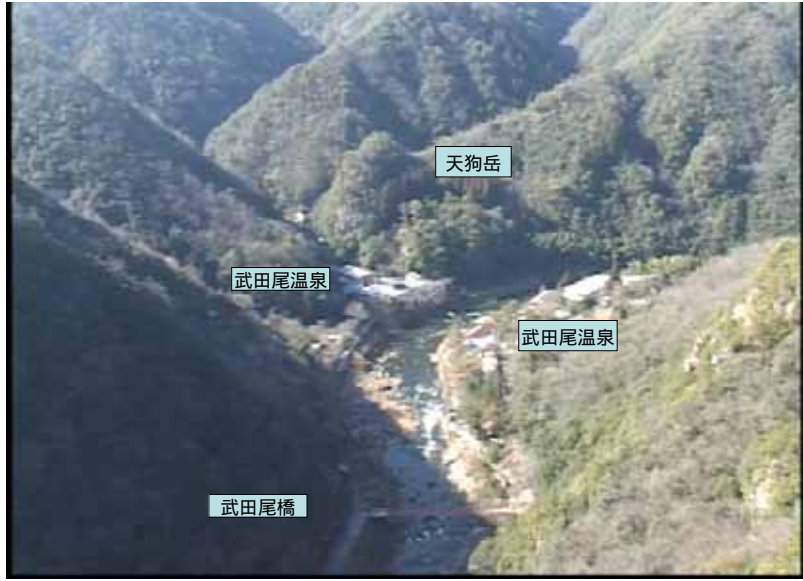
武庫川下流 0:21:18 No.1-51