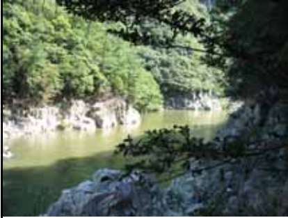
北山第2トンネル周辺