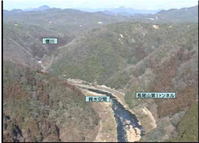
武庫川下流 0:19:49 No.1-45