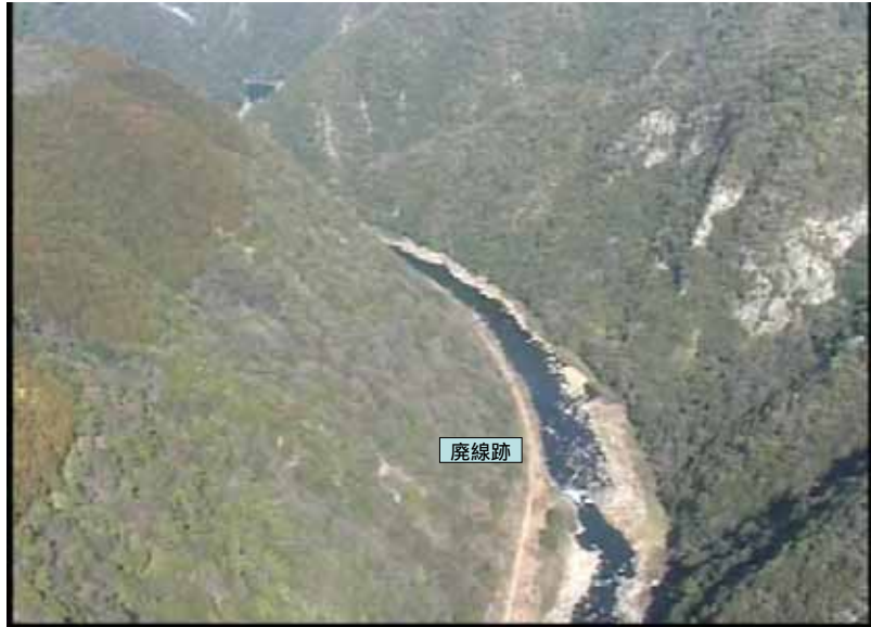
武庫川下流 0:16:56 No.1-32