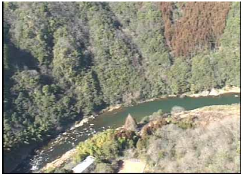
武庫川下流 0:21:40 No.1-53