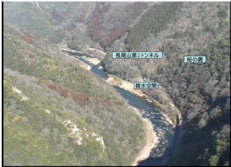
武庫川下流 0:19:27 No.1-43