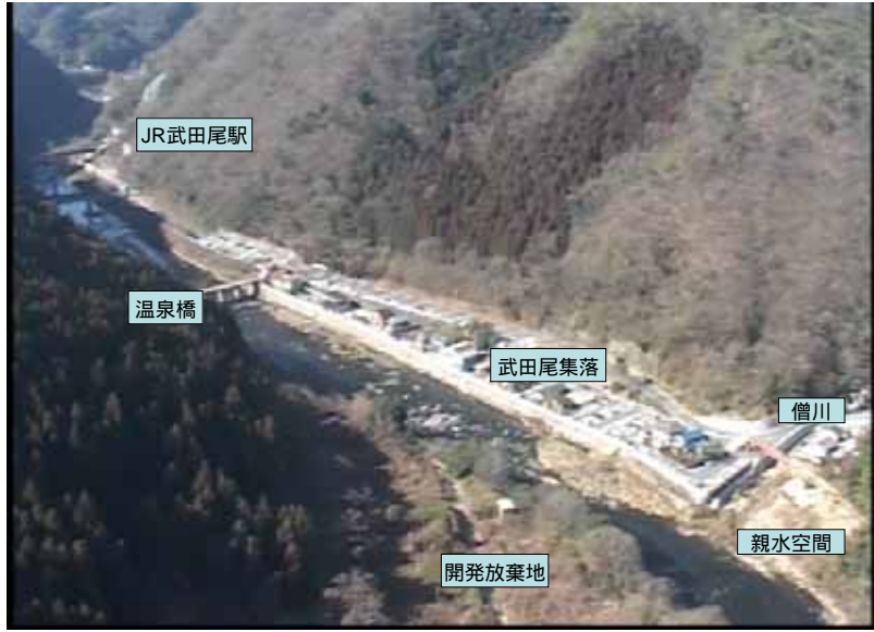
武庫川下流 0:20:16 No.1-47