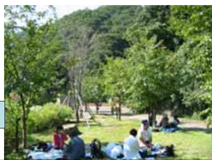
桜回廊 エントランス 広場