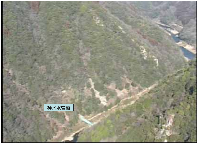
武庫川下流 0:19:09 No.1-41