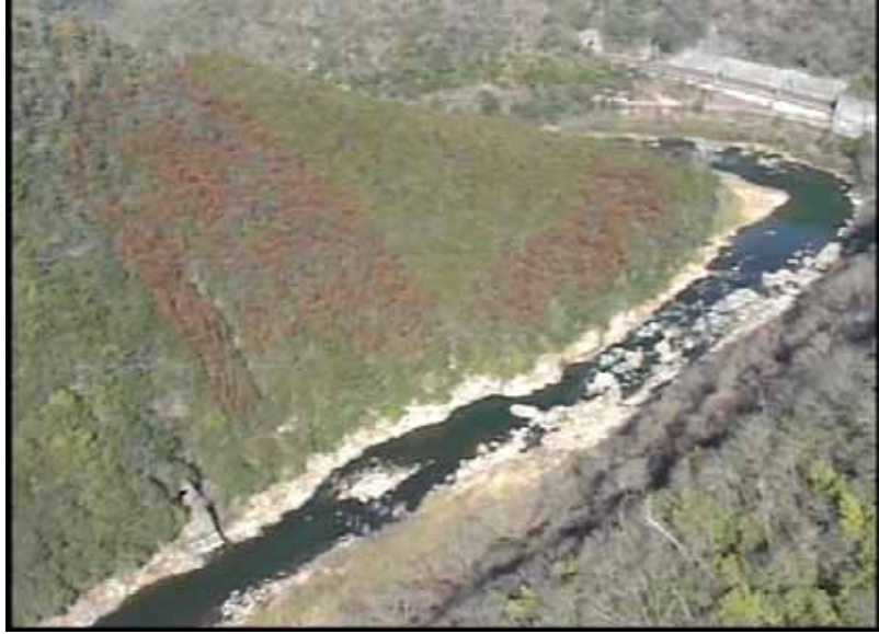
武庫川下流 0:21:46 No.1-54