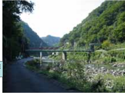
神戸市水道 水管橋