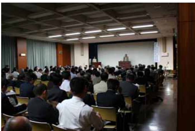
第8回 リバーミーティング