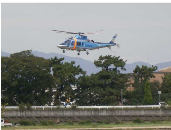
防災総合訓練の実施