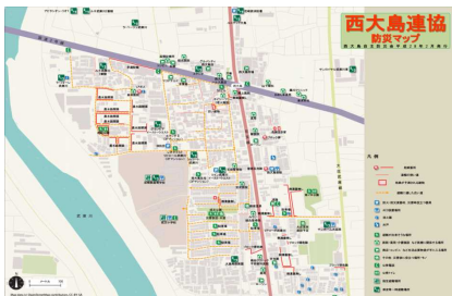
地域防災マップの作成