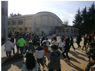
1. 17は 忘れない 地域防災訓練