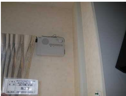
老人福祉施設への防災行政無線（戸別受信機）の整備