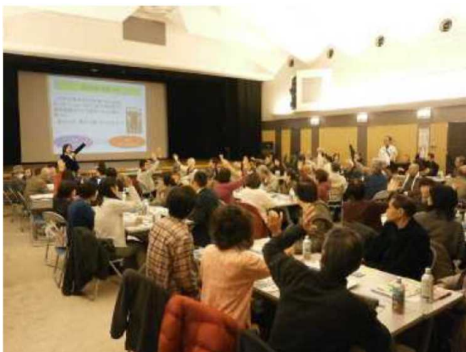
防災セミナー ・テーマ別開催 ①企業②家庭③地域