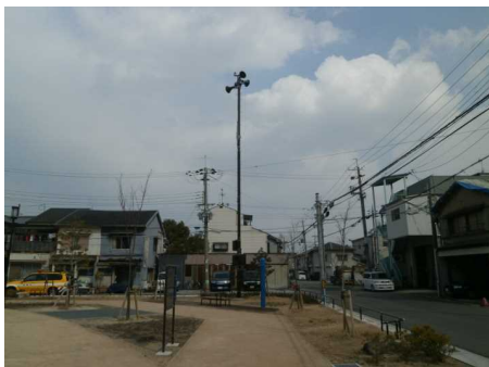
防災行政無線（屋外拡声器）の整備