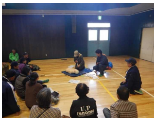
自主防災会による 防災訓練