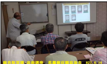
総合防災講座・出前講座 花屋敷荘自治会 H27.6.14