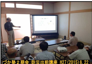
づか塾 2期会・防災出前講座 H27(2015)8.22