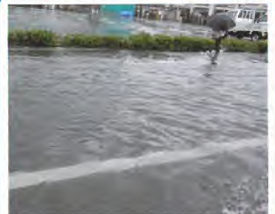
大雨で道路が水浸しになっている様子 (神戸市内)