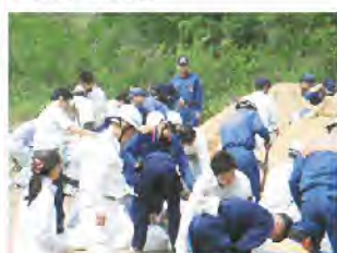
水防技術講習会土のう作成