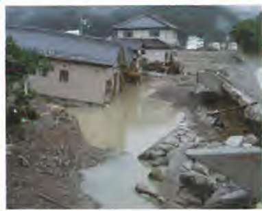
平成21年台風9号による被害 (千種川水系佐用川:佐用町)