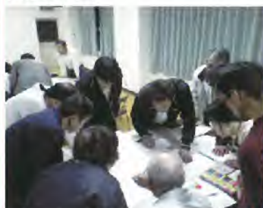
地域防災マップ作成ワークショップ