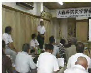
防災に関する講演会