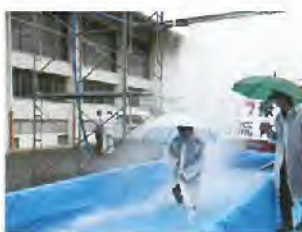
太子町ゲリラ豪雨体験