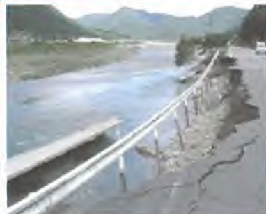
平成23年台風12号による被害 (加古川水系杉原川:多可町)