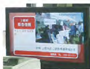
土砂災害情報伝達演習