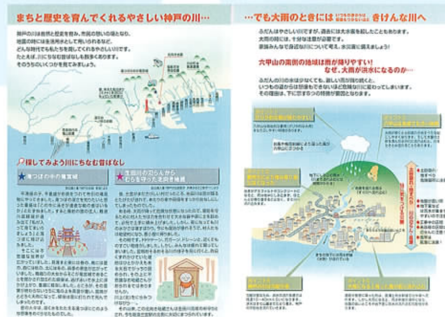
※洪水ハザードマップ:洪水のはらんなどによる人的被害を軽減することを主な目的として、浸水情報、避難情報などの各種情報をわかりやすく図面などに表示したものを示す。

このため、防災活動や避難行動に役立つ情報をわかりやすく提供するとともに、インターネットなどによる即時性の高いメディアを活用し、洪水予報などに関する情報を提供していきます。