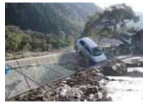
洪水により流された自動車