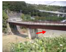
洪水によりひずんだ森興橋