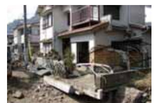
洪水により被災した家屋