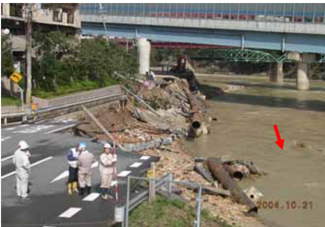
生瀬橋周辺の災害状況