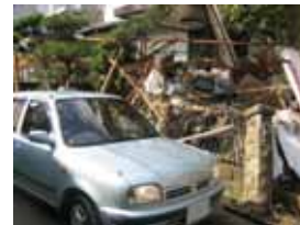
洪水により被災した家屋