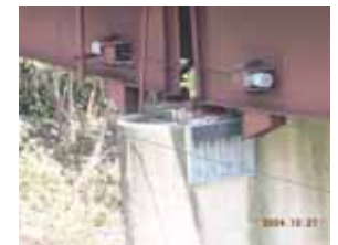
ひずんだ森興橋のジョイント部