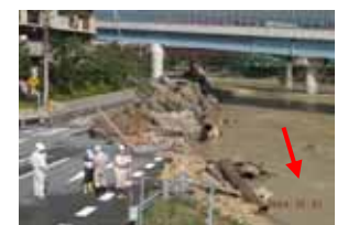
(生瀬大橋上流) 洪水により崩壊した護岸及び道路