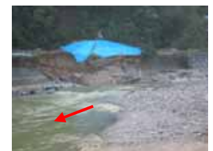
(見返り岩上流) 洪水により崩壊した護岸及び道路