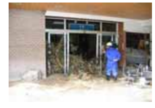
洪水により旅館玄関に押し寄せた土砂等