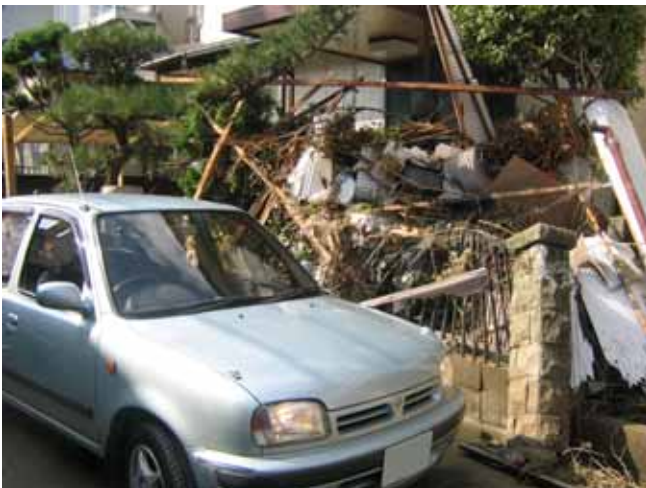
リバーサイド住宅の災害状況