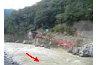
洪水により流された武田尾橋