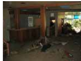
洪水により旅館内部に堆積した土砂