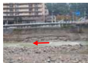
(生瀬大橋下流) 洪水により崩壊した護岸の根元