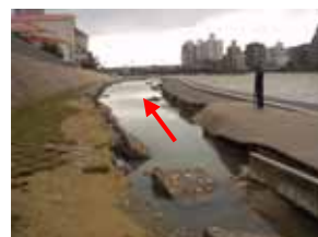
(見返り岩下流) 洪水により被災した高水敷