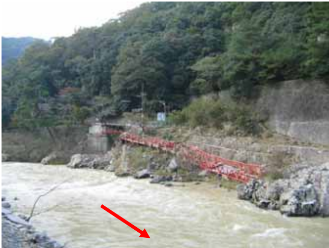
洪水により流された武田尾橋