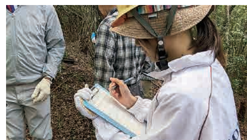
植生調査・植生管理を学ぶ