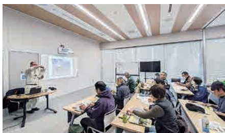
県や市町の環境部門の協力体制