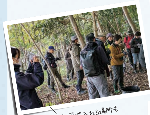
特別な許可で入れる場所も (伊丹市・昆陽池公園)