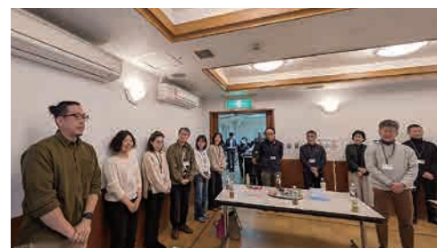
交流会による親睦