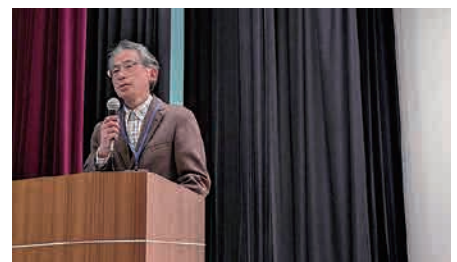
北摂里山愛す会（北摂里山大学OB会）