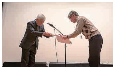
修了者には記念品の贈呈も