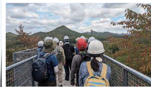
ふるさとを再発見できる(三田市・有馬富士公園)