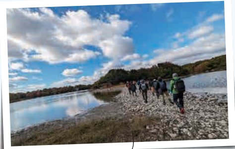
池の水を抜いて島へ渡る(伊丹市・野鳥の島)