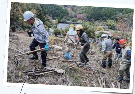
作業の安全講習や里山整備実習も (川西市・黒川)