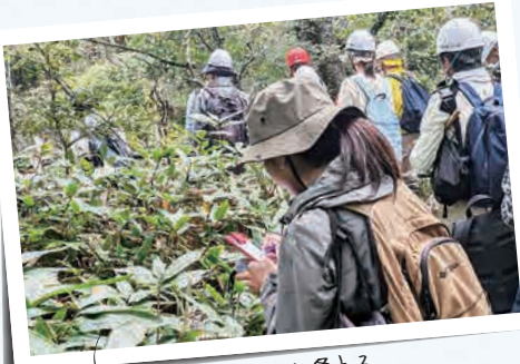
いろいろな植物に出逢える (三田市・有馬富士公園)