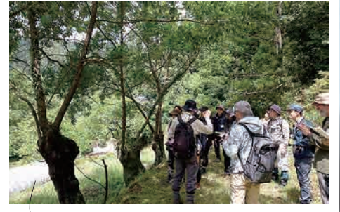
日本一の里山を訪ねる(川西市・黒川)