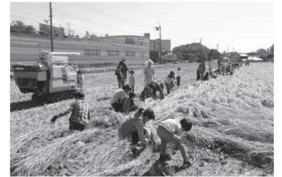
世界稲刈り選手権

また、10月12日と18日の午前9時30分から、世界田植え選手権と同じ会場で、「世界稲刈り選手権」を開催しました。12日は有馬高校の生徒たちが、18日は伊丹市内の園児・小学生たちが両日合わせて約90名参加し、枯れ葉堆肥を使った田んぼで育った稲を刈り、この田んぼから収穫した米を使って盛大に餅つき大会を開催しました。