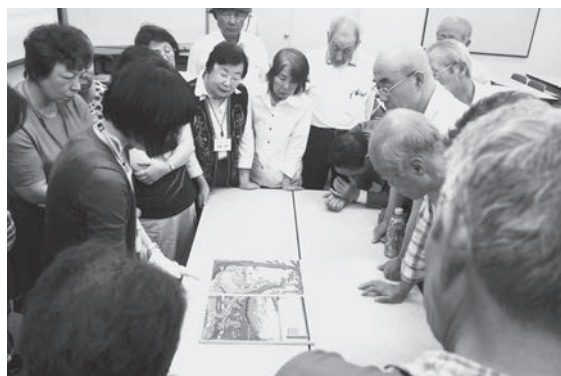
県立人と自然の博物館