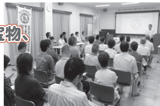
三田市すずかけ台喫煙防止教室