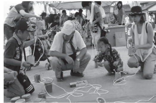
「自分で作って遊ぶのはたのしいな〜」