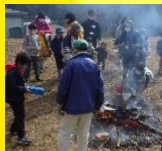
焚き火の中に缶を入れて焼こう