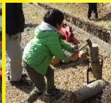
待っている間に薪割りを体験しよう