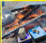
炭が焼けるまでしばらく待とう