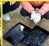
飾り炭のできあがり！