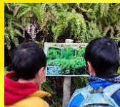
森を歩いて木の実や葉っぱを集めよう

古くから茶道などに使う高級木炭「菊炭」の産地として知られる川西市黒川地区。県立一庫公園では、今も菊炭づくりが行われています。この冬一庫公園を訪ね、炭づくりの原理を学ぶ「飾り炭づくり」や炭窯見学を通じて炭焼き文化にふれるツアーを開催します。ぜひご参加ください。