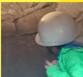
炭窯の中に入ってみよう