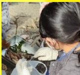
缶の中に木の实や葉っぱを並べよう