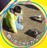
飾り炭できたかな？