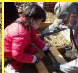
のこぎりも体験しよう