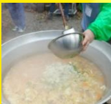
お昼は豚汁と金炊きご飯を食べよう