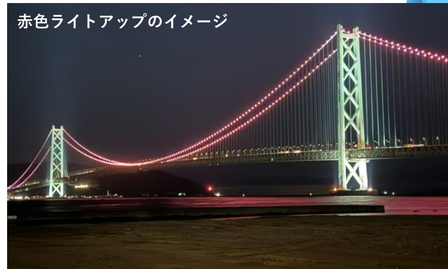
赤色ライトアップのイメージ