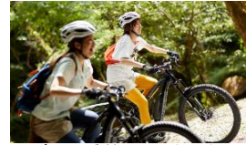
[赤西溪谷のせせ°-パーク]