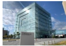
[人と防災未来センター]