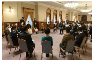
[コンシェルジュ認定式]