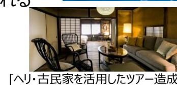
[へり・古民家を活用したツアー造成]