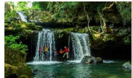
[神鍋溶岩流カバートレッキング]