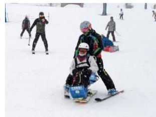
[専用スキーを用いたスキー体験]