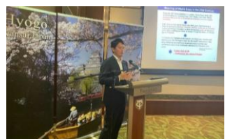
[シンガポールでのトッププロモーション]