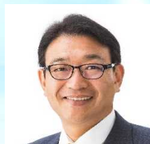
清元 秀泰 姫路市長