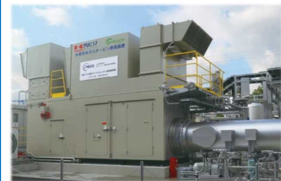
水素コージェネレーション実証設備 （市街地における水素100%がスタービン発電実証）