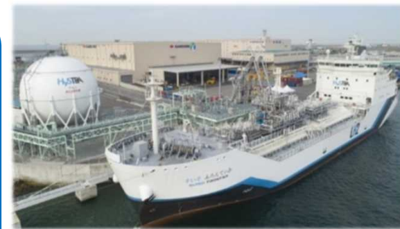
液化水素運搬船、液化水素タンク （世界初となる日豪間の液化水素運搬実証）