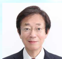
久元 喜造 神戸市長