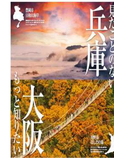
観光共同プロモーション (10.31~11月中旬)

全国旅行支援の開始など 秋からの観光需要回復の タイミングに合わせ、 さらなる誘客を図る