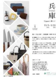
特産品プロモーション (11.1~1.31)