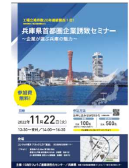
兵庫県首都圏企業誘致セミナー (11.22)