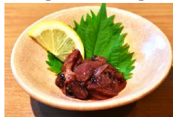
【ホタルイカ沖漬け】