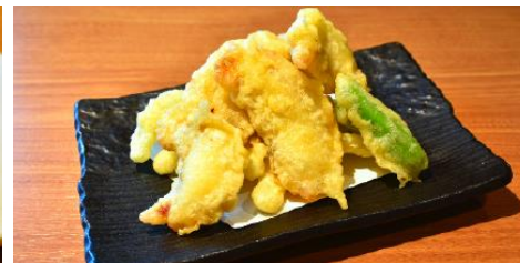
【明石だこと玉ねぎの天ぷら】