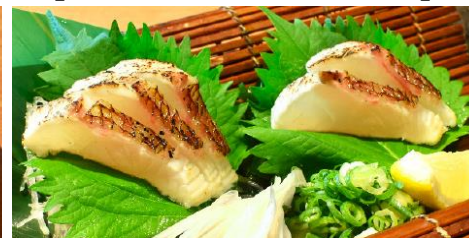
【淡路島えびす鯛の藁焼き】