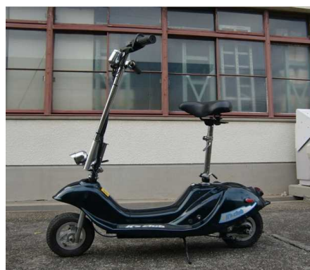
折りたたみスクーター