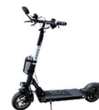
電動キックボード [E-KON grande street]

11月27日(土)から12月19日(日)までの土日において、JR 相生駅から公園都市までの路線バスの往復チケット、都市内での昼食、超小型EV、電動キックボードの利用が組み込まれた観光ツアーを神姫観光(株)が有償にて実施します。「西播磨 MaaS」より申し込みできます。