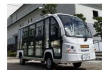
グリーンスローモビリティ [TAJIMA NAO-8J]

実施期間は、11 月 25 日 (木) から 12 月 22 日 (水) です。