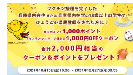
キャンペーンページ TOP画面