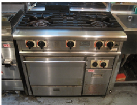
業務用ガスコンロ