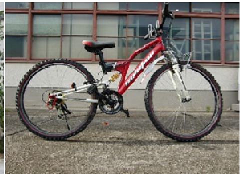
マウンテンバイク