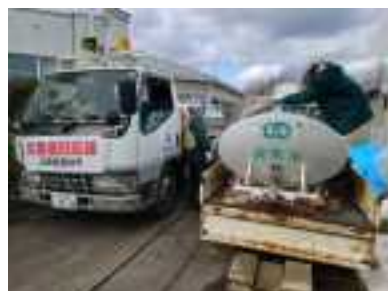
給水車(高砂市) 【2/1に穴水町へ派遣】