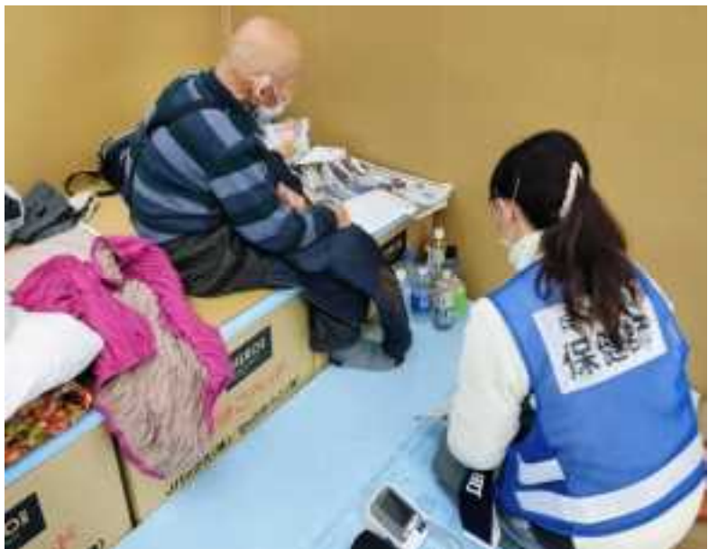
【保健師による避難所での健康管理業務(穴水町) 2/1】