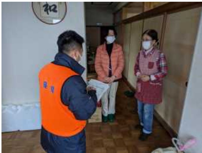
【避難所運営支援職員の活動(珠州市) 2/8】