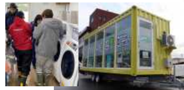
移動式ランドリー(養父市) 【1/23に珠州市へ派遣】