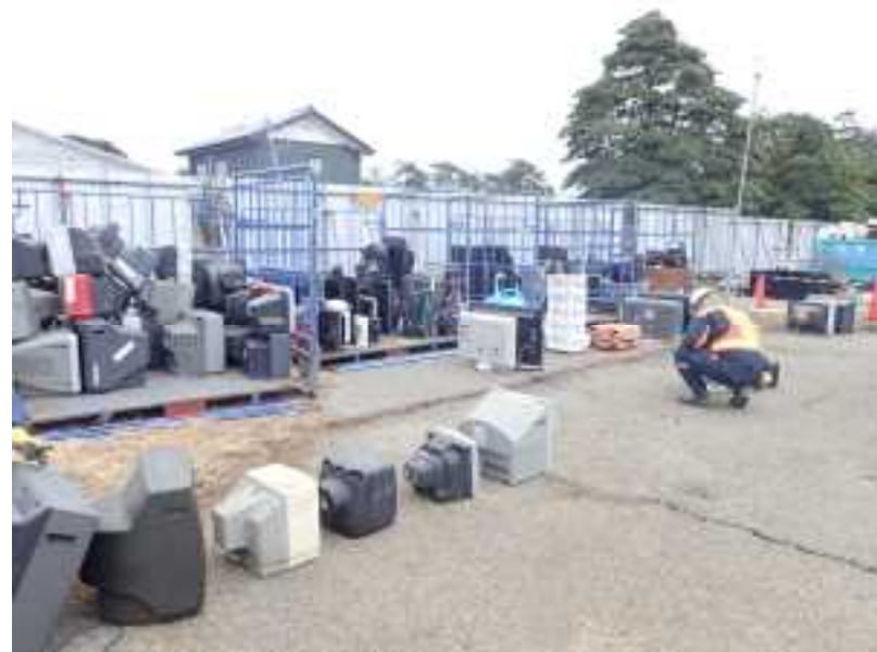
【ガレキ処理支援活動(珠州市) 2/4】