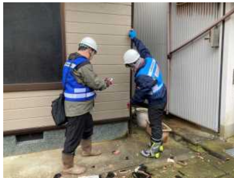
【家屋被害認定調査の支援活動(珠州市) 2/8】