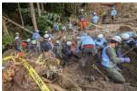
緊急消防援助隊兵庫県大隊 【2/4に輪島市へ派遣】