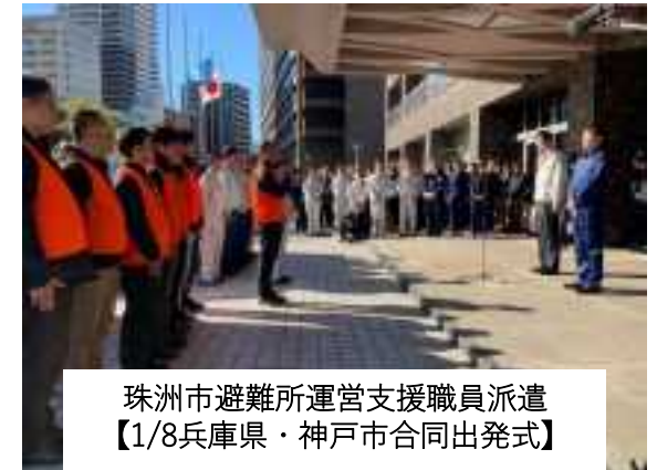
珠州市避難所運営支援職員派遣 【1/8兵庫県・神戸市合同出発式】