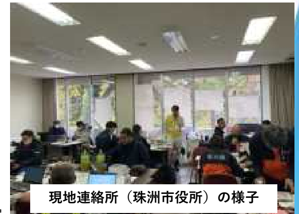
現地連絡所（珠州市役所）の様子