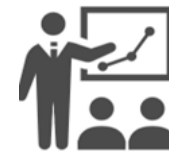
専門家によるセミナー 現地指導