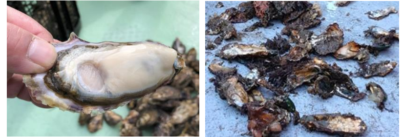
正常に成長した養殖マガキ(例年) へい死した養殖マガキ