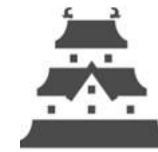
旅行社等の モニターツアー