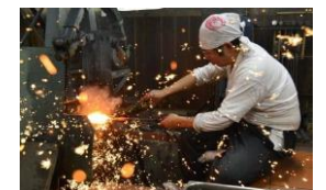
桔梗隼光 刀鍛冶の技