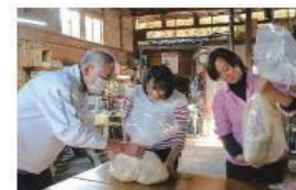
井戸靴店 味噌づくり体験