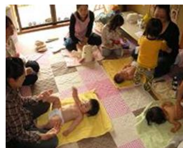
乳幼児子育て応援事業の状況