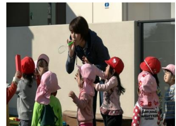
保育士と子どもたち（保育所）

幼稚園、保育所、認定こども園を利用する子どもに対する共通の財政支援として、公定価格から利用者負担額を控除した公費負担額のうち、県費負担分を市町に支弁する。