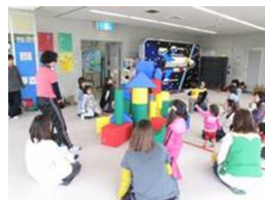
地域子育て支援拠点の状況