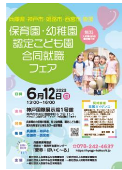
就職フェアのポスター