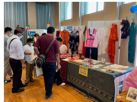
子ども多文化共生センター展示 (ひょうご・ヒューマンフェスティバル)