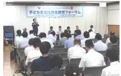
子ども多文化共生教育フォーラム (ひょうご・ヒューマンフェスティバル)