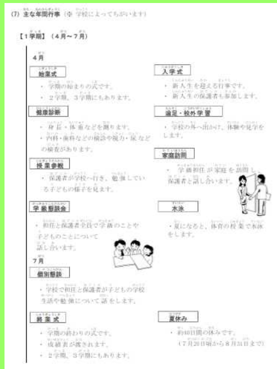
就学支援ガイドブック(日本語版)