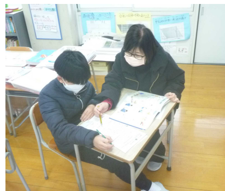
サポーターによる支援の様子