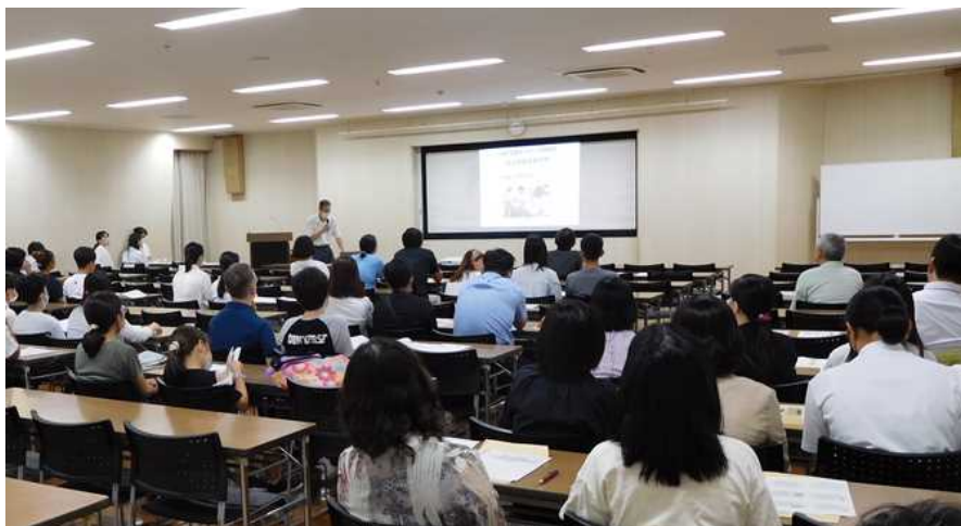
就学支援ガイダンスの様子