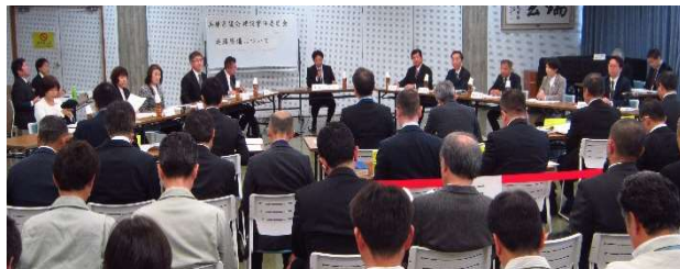
過去の地域開催の様子

今回は、丹波地域で開催する「文教常任委員会」、阪神北地域で開催する「警察常任委員会」の傍聴を募集します。