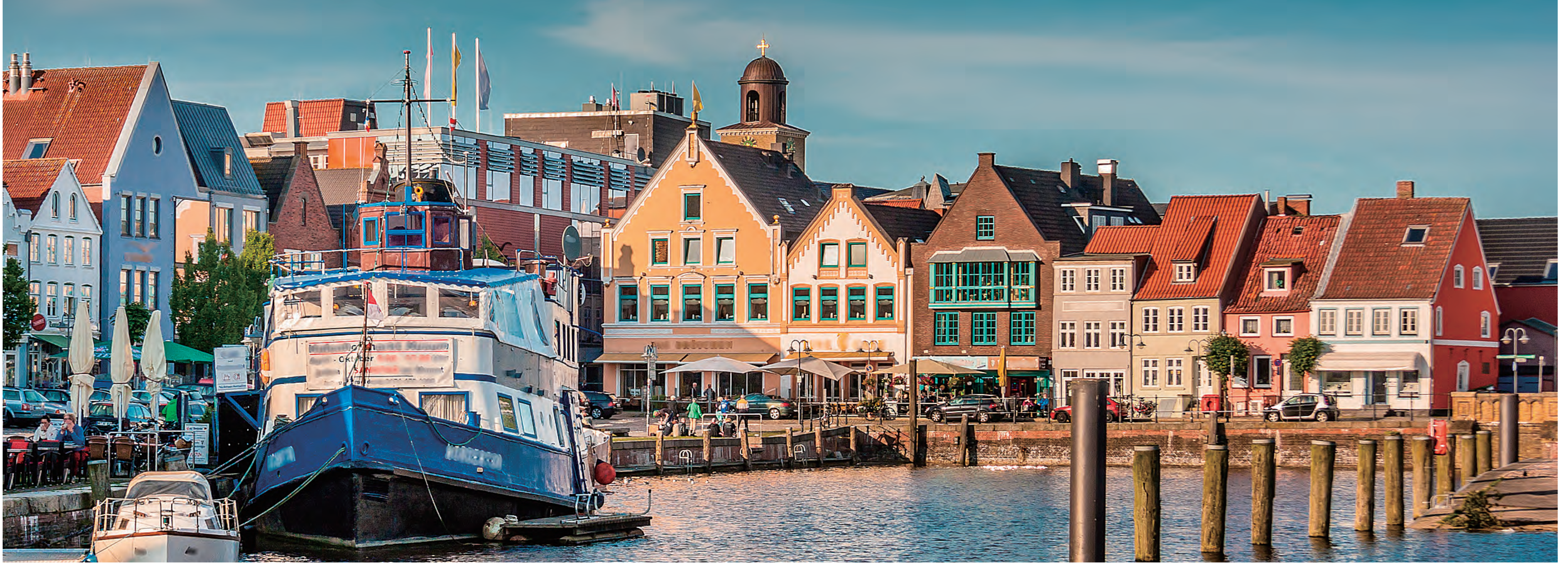
ワッデン海沿いの町フーズム Husum along the Wadden Sea