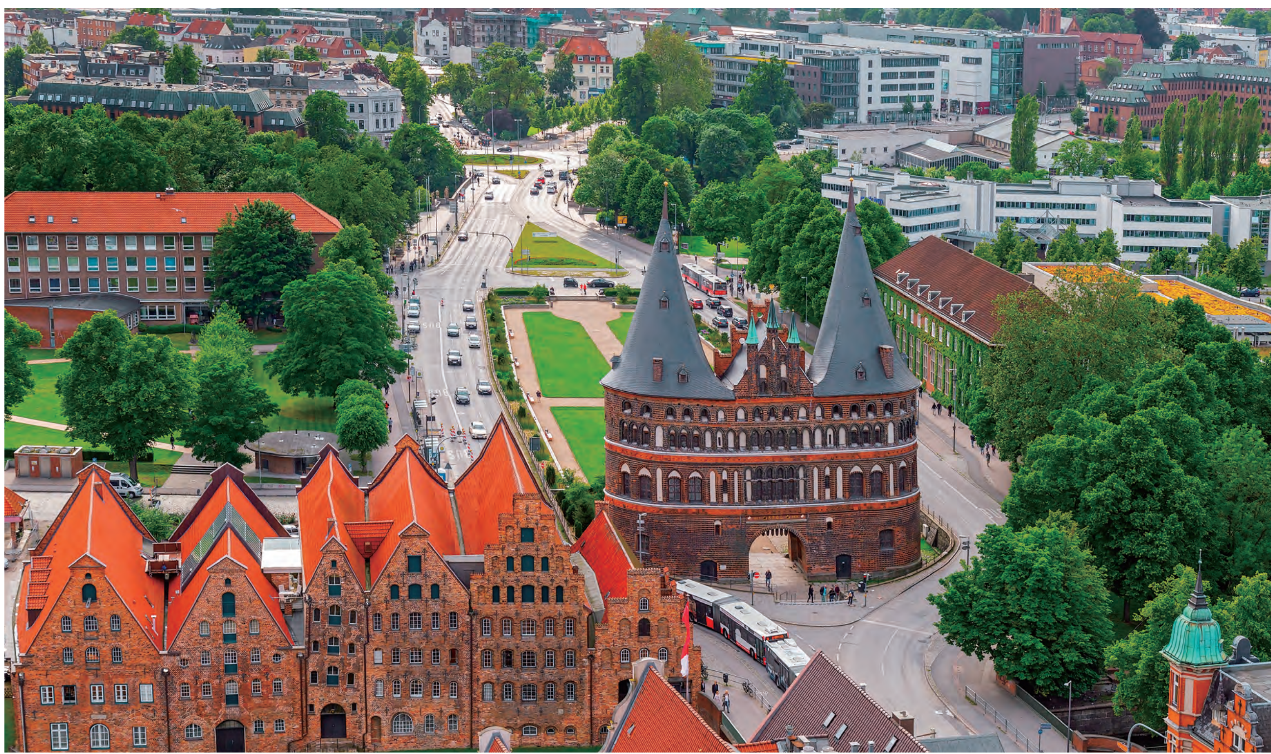
リューベック旧市街 Old town of Lübeck