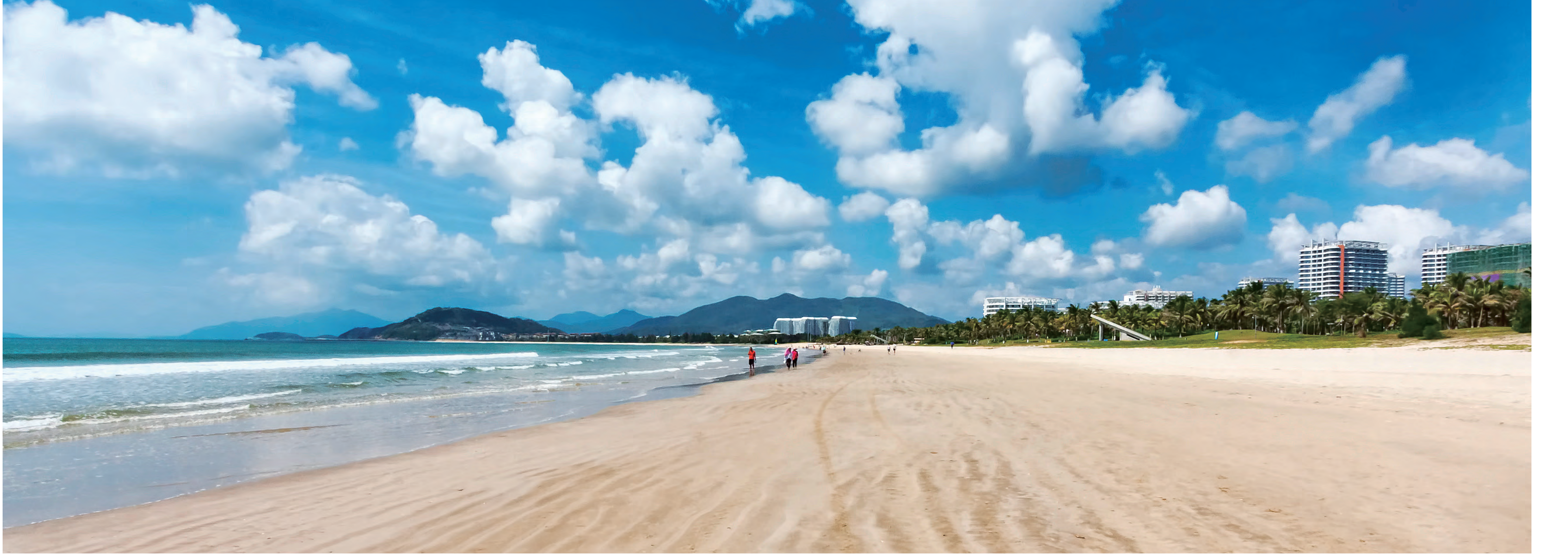
海南島のビーチ Beach in Hainan Island