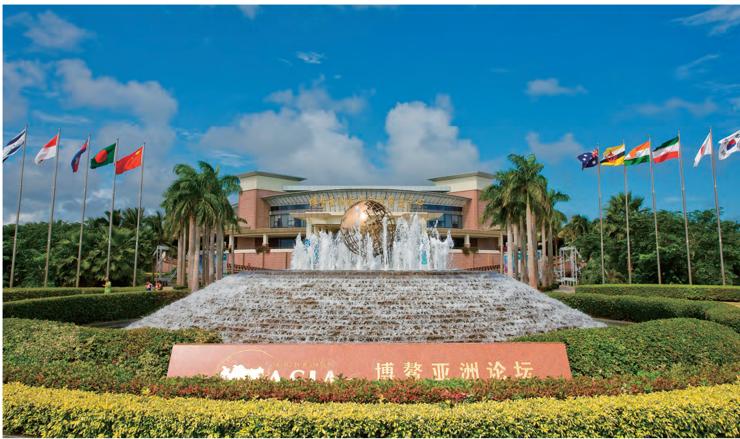
ボアオ・アジア・フォーラム国際会議場 BOAO Asia Forum International Conference Center