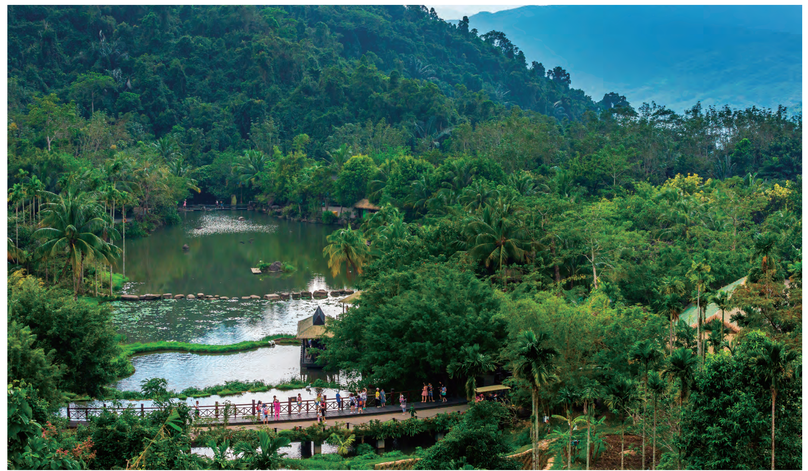
熱帯雨林などの豊かな自然 Rich natural environment represented by tropical rainforests