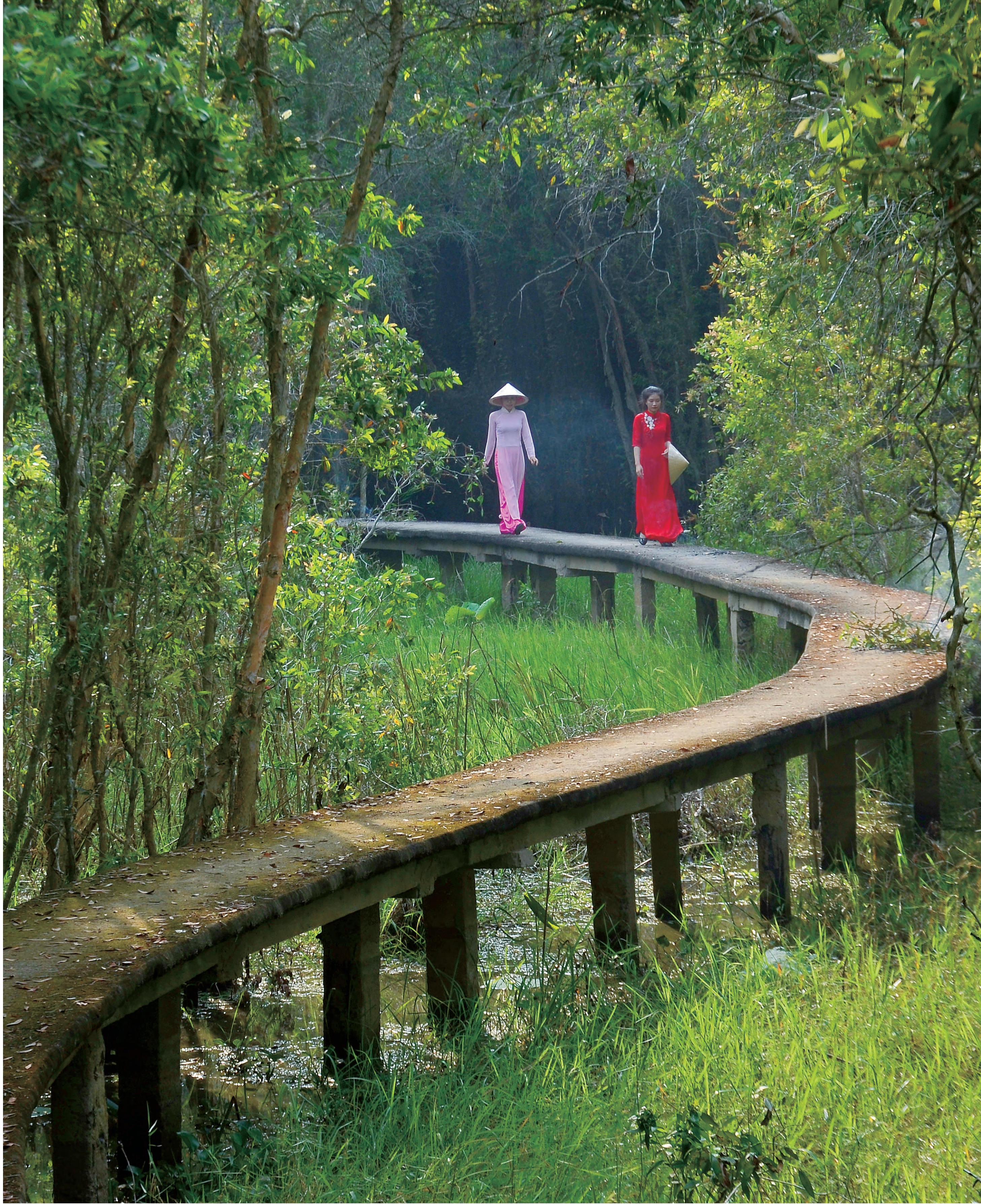
ラン ノイ タン ラップ エコツアーリスト Lang Noi Tan Lap Eco Tourist Site