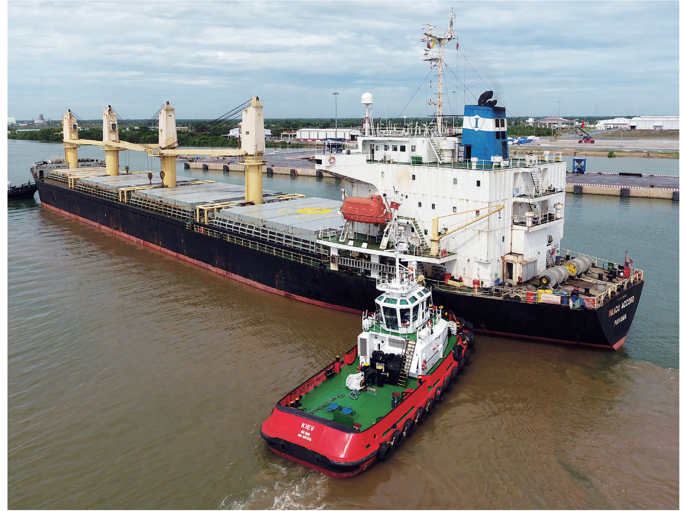
ロンアン国際港 Long An International Port