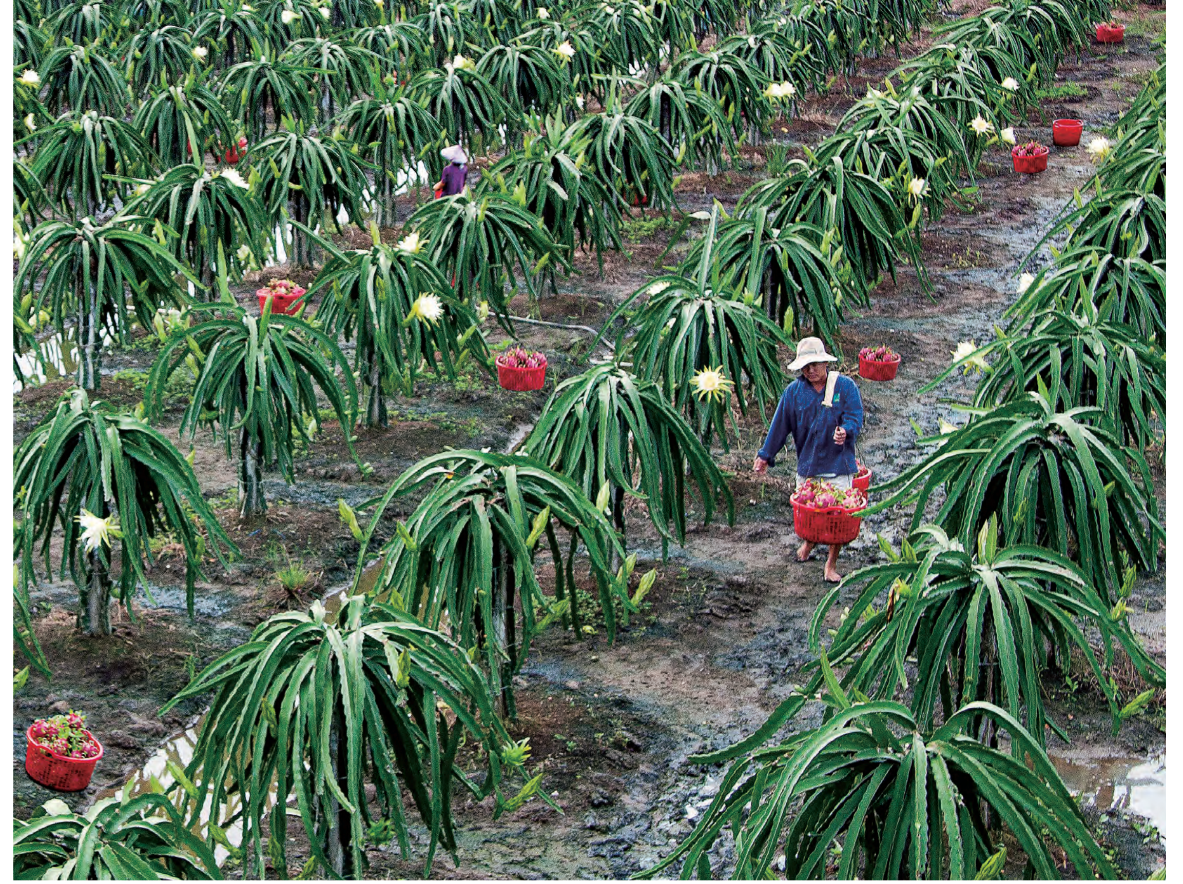
ドラゴンフルーツの収穫 Dragon fruit harvesting