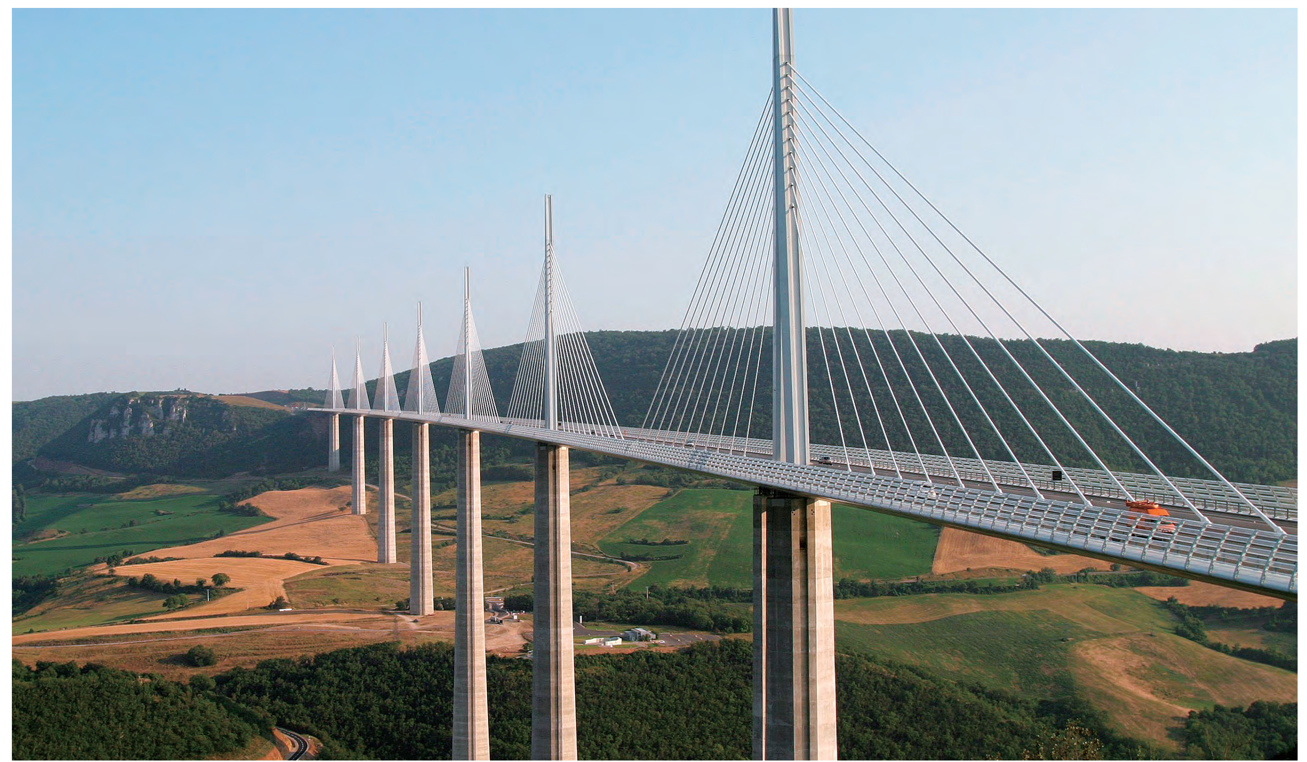
タルン川渓谷に架かるミヨ橋 Millau Bridge over the Tarn River Valley