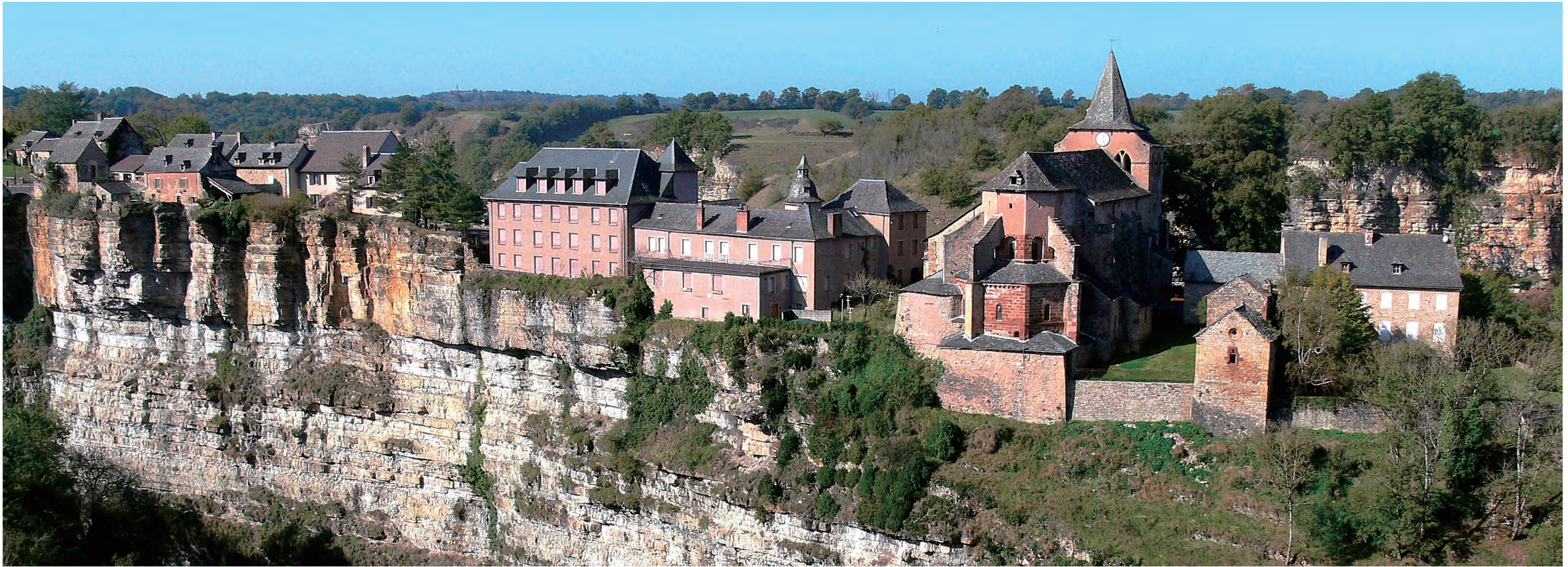
断崖に立つボズール村 Bozouls village standing on a cliff