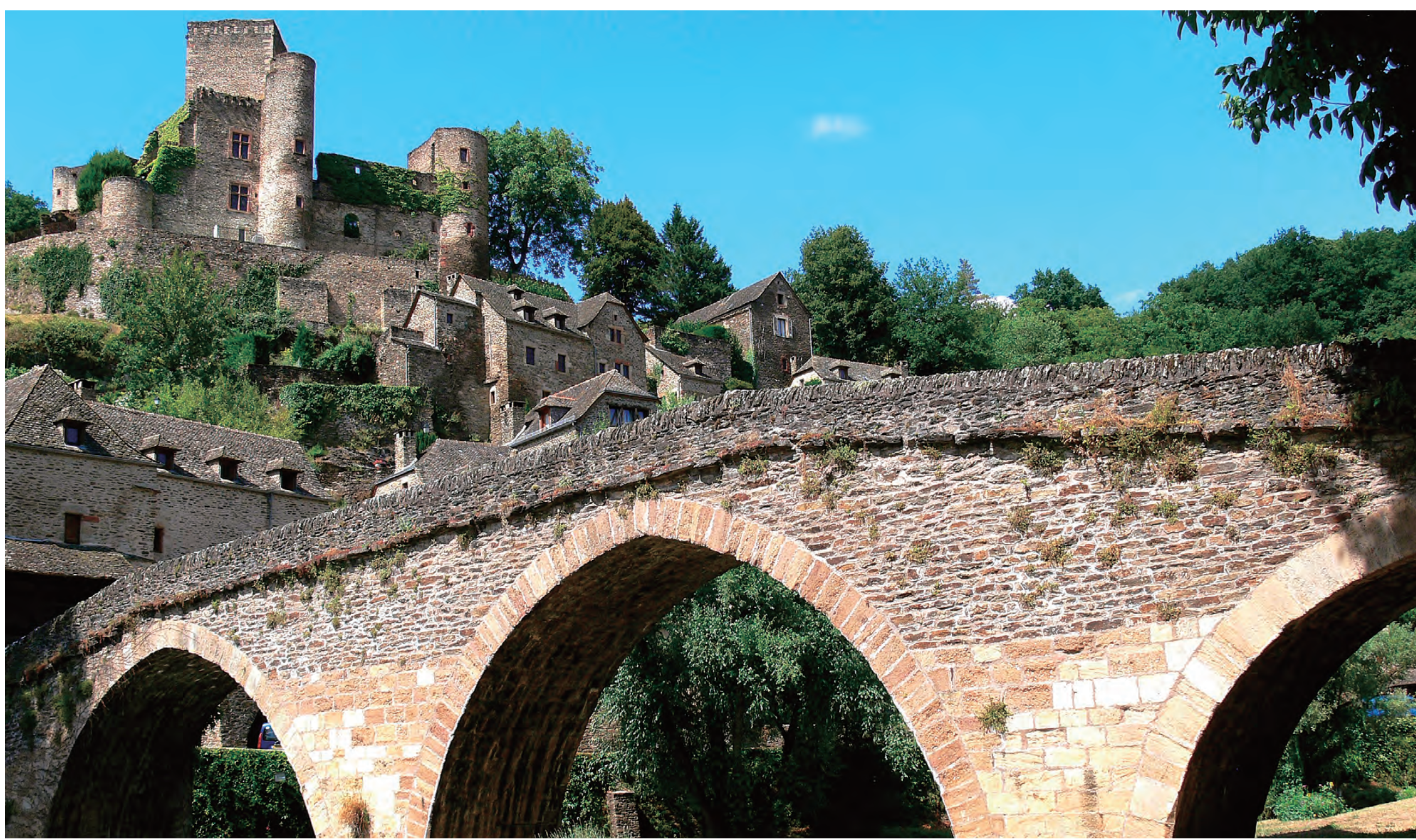
アヴェロン川に架かるベルカステル橋 Belcastel Bridge over the Aveyron River