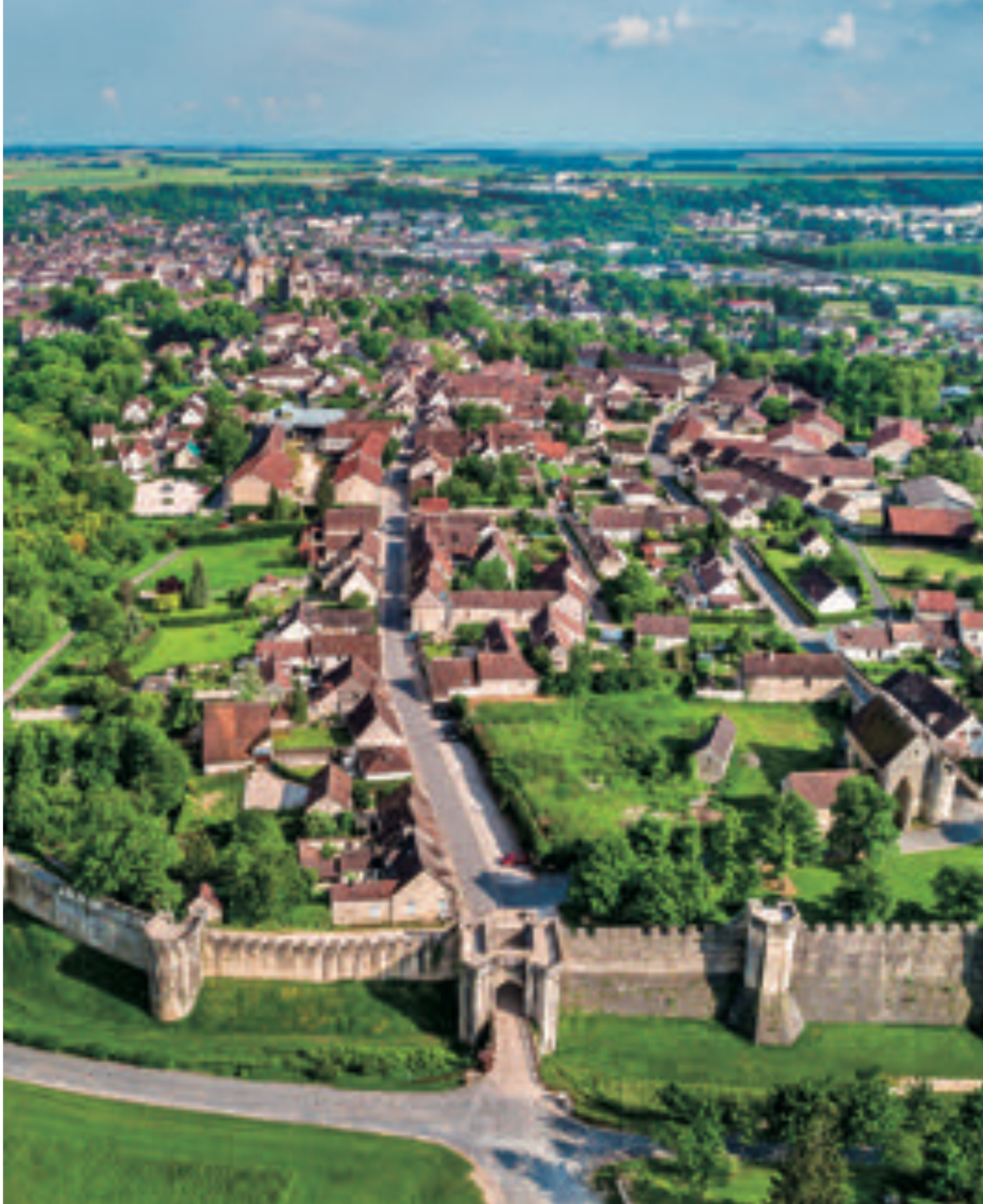
世界遺産・中世市場都市プロヴァン "Provins, Town of Medieval Fairs" registered as a World Heritage site