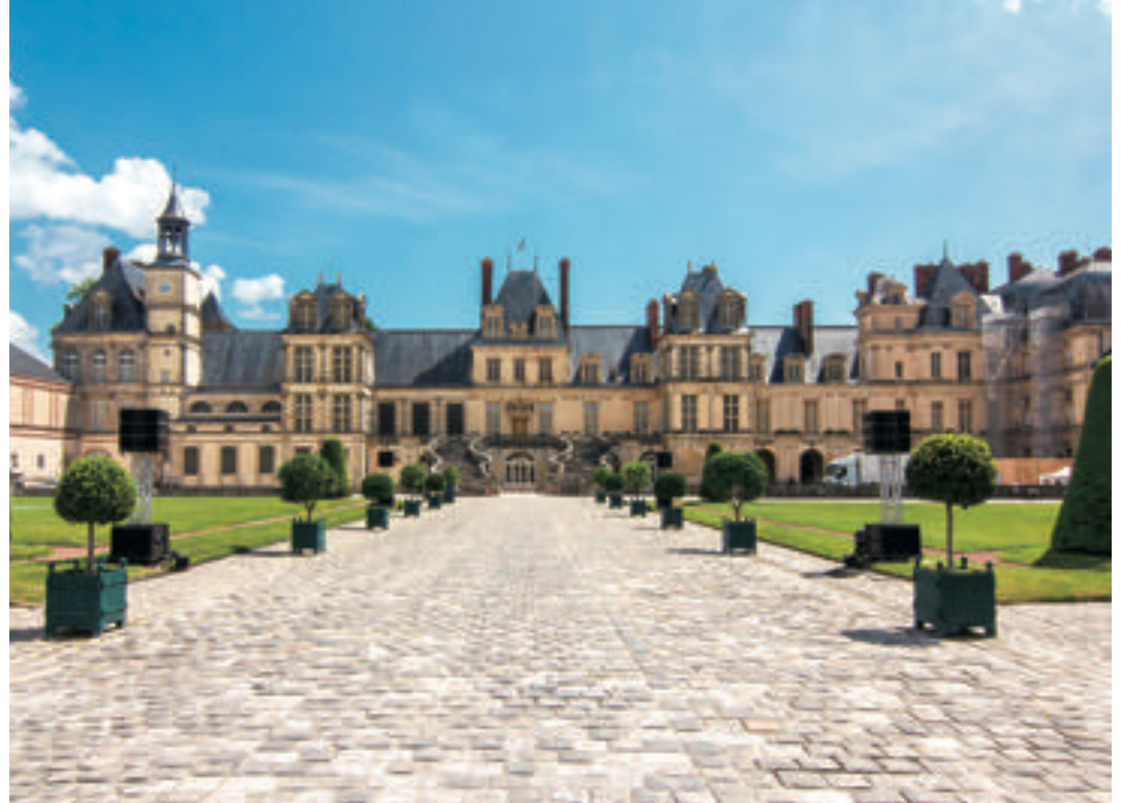
フランスで最も大きな宮殿 フォンテーヌブロー宮殿 France's largest palace:Château de Fontainebleau