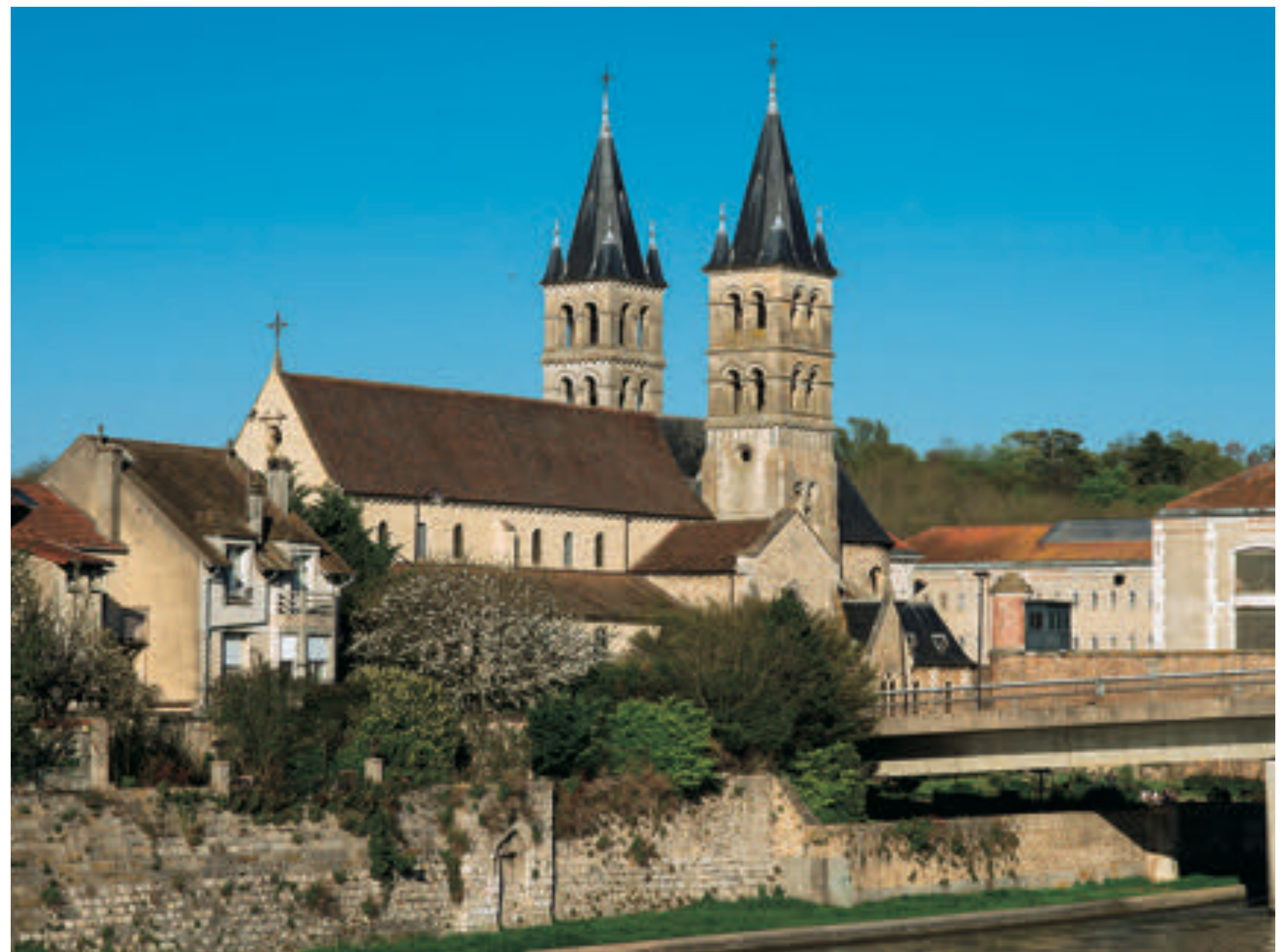
ノートルダム聖堂(ムラン) Collegiate Church of Notre-Dame (Melun)