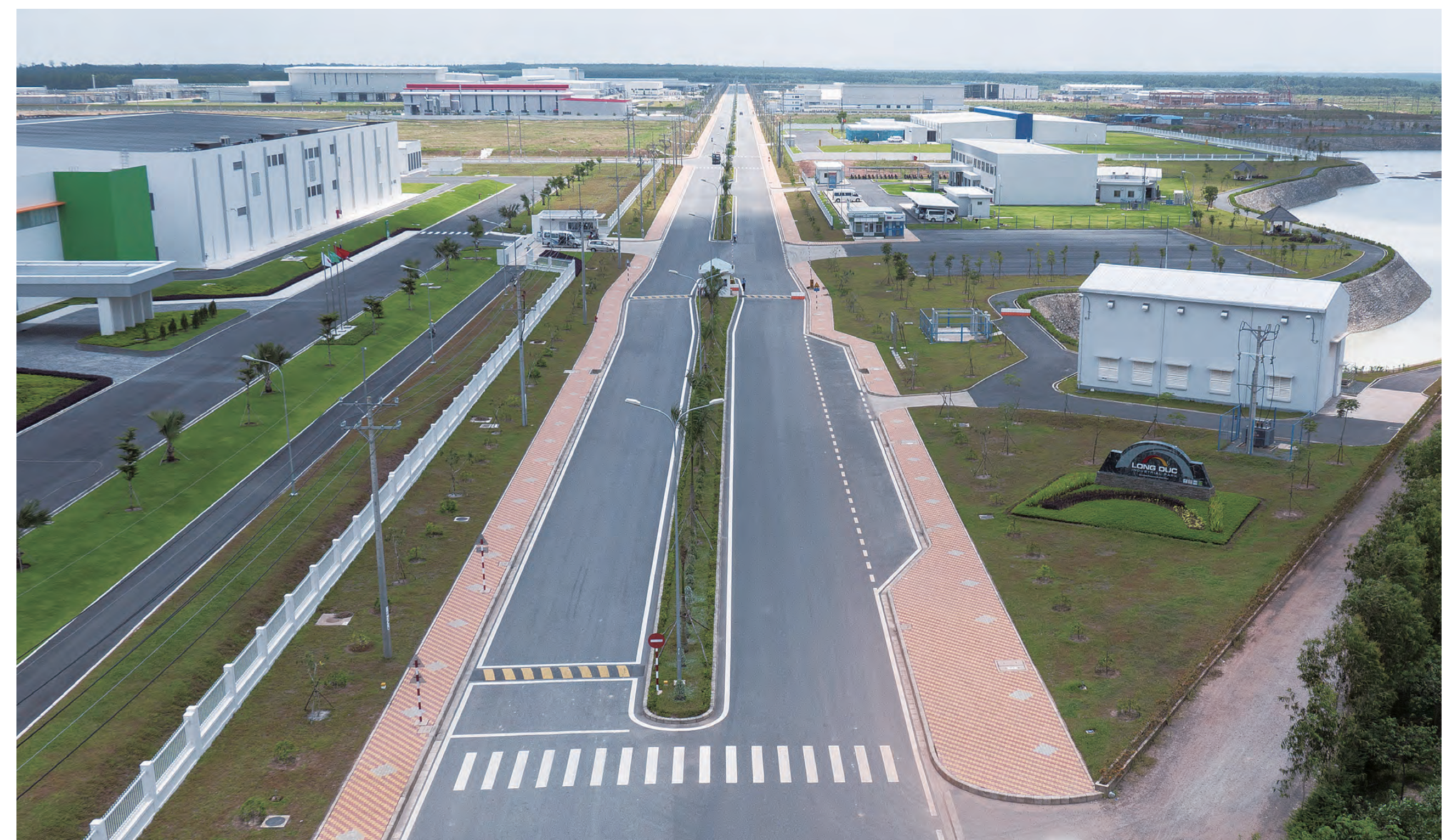
ロンドウック工業団地 Long Duc Industrial Park