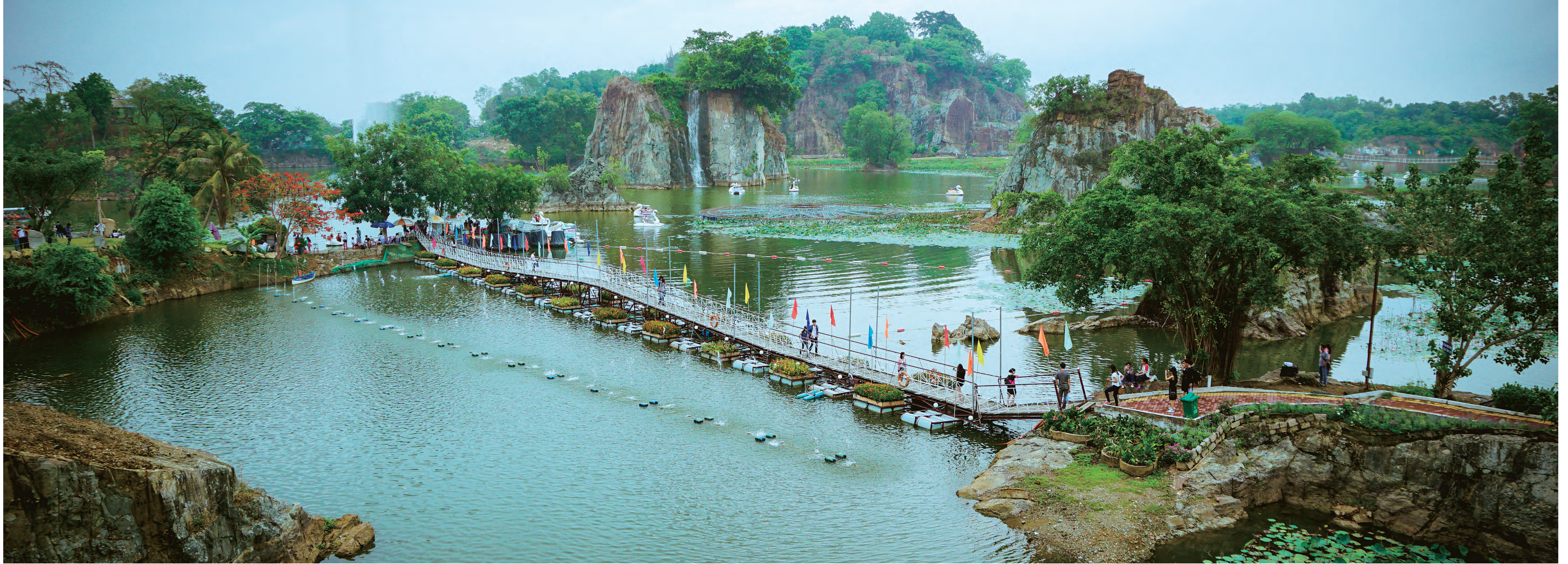
ビエンホア市郊外のブーロン観光区 Buu Long in the suburb of Bien Hoa City