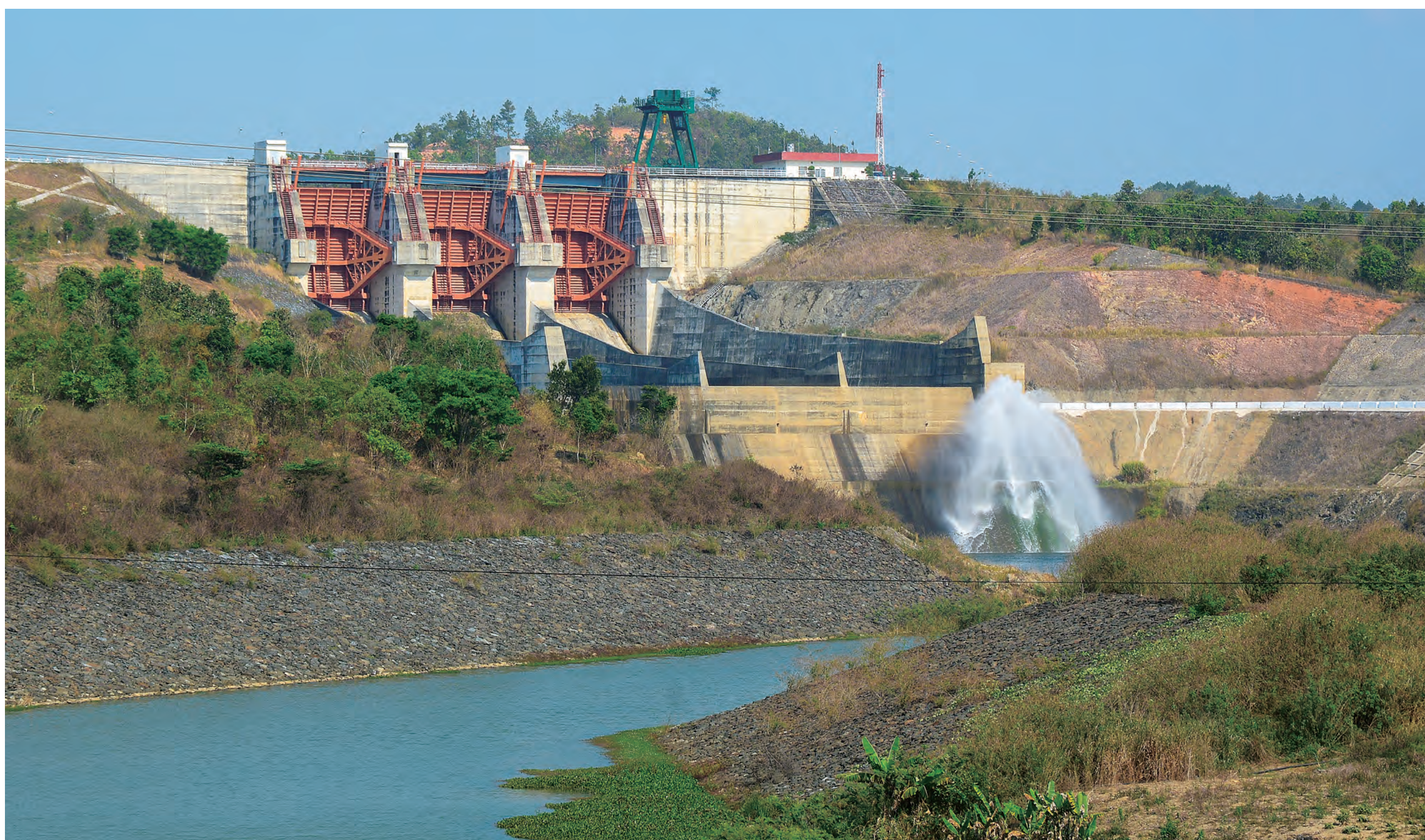
ドンナイ川の水力発電所 Hydropower plant on the Dong Nai River