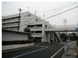
【駐車場】 カーパークつつじ