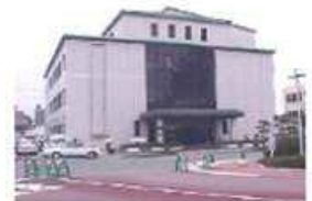
【会場】4階 大会議室 青少年女性センター