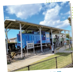
#播磨町 #大中遺跡公園