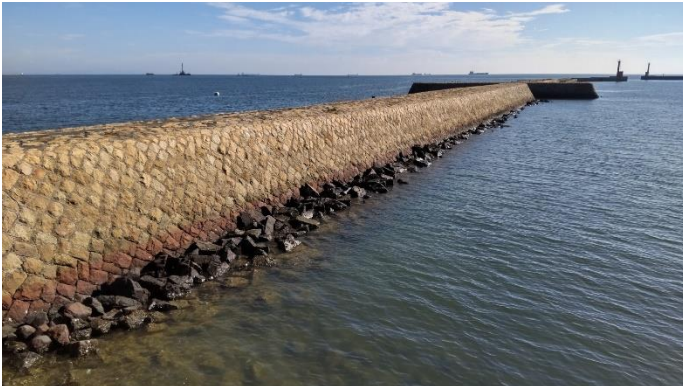
東防波堤 (一文字波止) L=95m+75m=170m