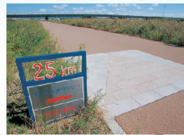
距離表示(1km間隔に設置しています)