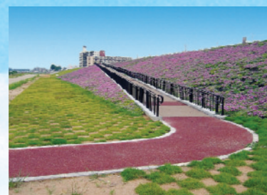
バリアフリー坂路 国土交通省により高齢者や障害者を含むすべての人々が水辺にアプローチしやすい坂路が整備され、河川空間のバリアフリー化が図られています。