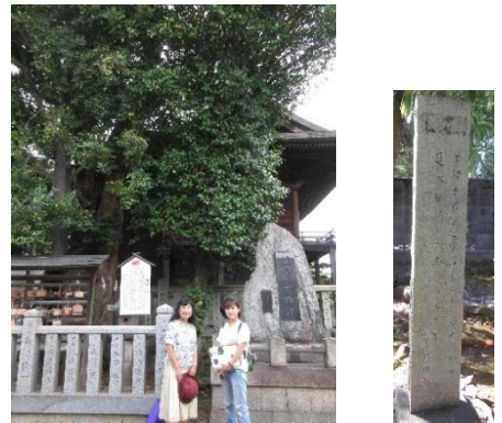
竹柏と司馬遼太郎文学碑 阿部知二の詩碑