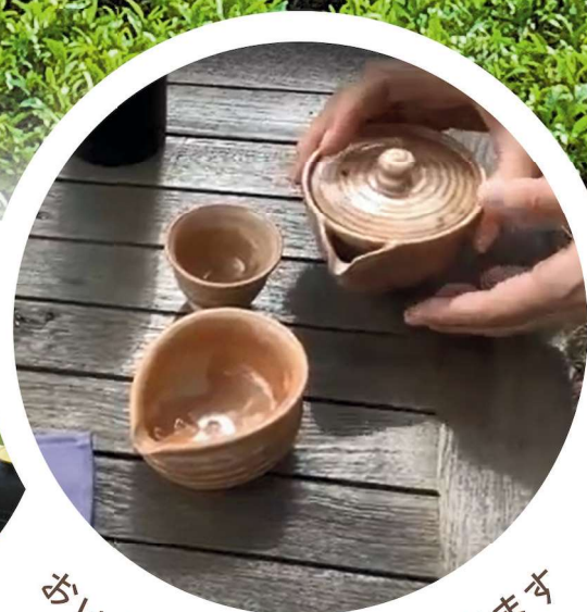
おいしい日本茶をいただきます