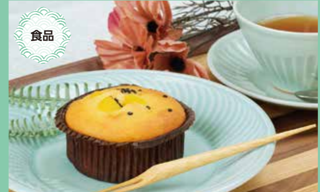
おいもマフィン 250円(1個85g) 賞味期限/製造日より30日

●事業所 社会福祉法人 姫路睦福祉会 障害福祉サービス事業所 真砂園 〒671-1134 姫路市大津区真砂町28 TEL:079-237-8076