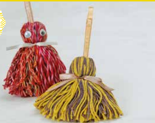
ハンディーモップ 600円(長さ約30cm)

●事業所 社会福祉法人 恵愛園 障害者デイサービス オレンジ三左衛門堀 〒670-0940 姫路市三左衛門堀西の町18 TEL:079-282-3300