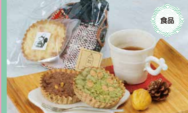
リスの座布団クッキー 350円(1個60g) 賞味期限/製造日より30日

●事業所 株式会社 ZAPPA てこぼこ 〒671-2231 姫路市石倉62-1 TEL:079-227-1965