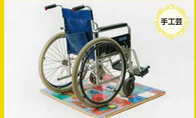
車椅子体重計 30,000円(縦約91cm×横約91cm) ※デジタル体重計(最大200kgまで測定可能)付き。車椅子は含まれていません。

●事業所 社会福祉法人 ひびき福祉会 ひびき de ほっと 〒671-0218 姫路市飾東町庄227 TEL:079-252-8488