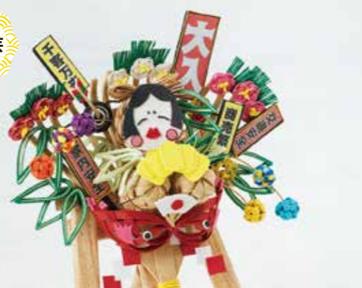
よくばり熊手 2,500円(高さ約30cm×幅約30cm)

●事業所 特定非営利活動法人 ろっこうの木 ろっこうの木 〒679-2303 神崎郡市川町上瀬加841 TEL:0790-27-0797