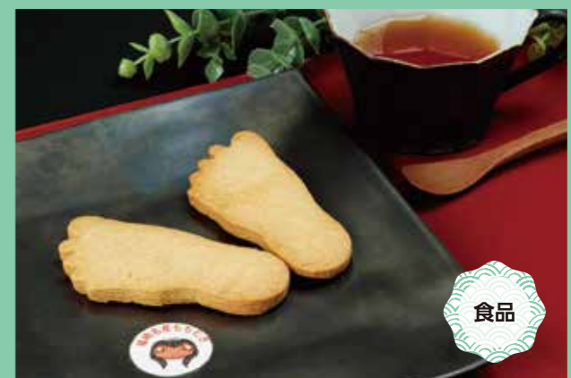
ガジロウさんの足サブレ 100円(1枚25g) 賞味期限/製造日より28日

●事業所 特定非営利活動法人 中播磨 峰の会 峰の会作業所 〒679-2204 神崎郡福崎町西田原1399-1 TEL:0790-22-7537 Instagram:minenokai