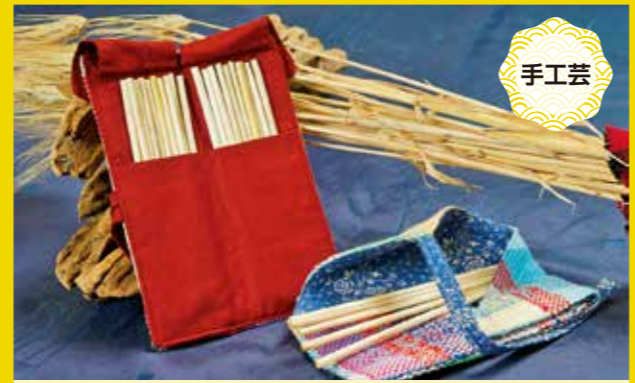
エコなストローセット 1,000円～1,300円(ケース(左) 縦約35cm×横約25cm)

●事業所 特定非営利活動法人 余部くすの木工房 余部くすの木工房 〒671-1261 姫路市余部区下余部475-1 TEL:079-227-8879