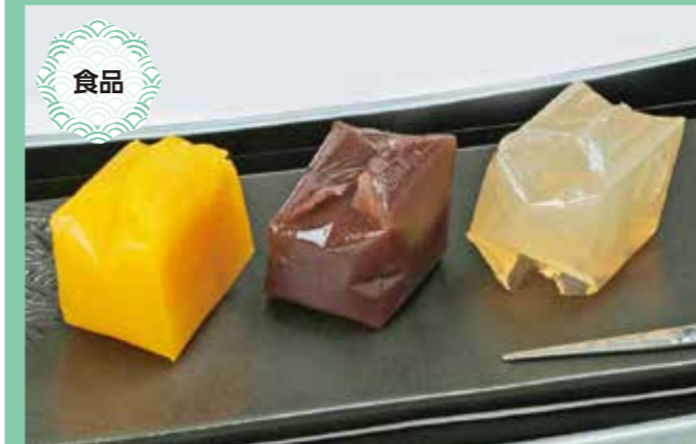
鉱石菓 250円～(1個50g) 賞味期限/製造日より14日

●事業所 社会福祉法人 姫路若葉福祉会 若葉福祉作業所 〒670-0985 姫路市玉手426-2 TEL:079-269-9874 Instagram:wakabaya-himeji