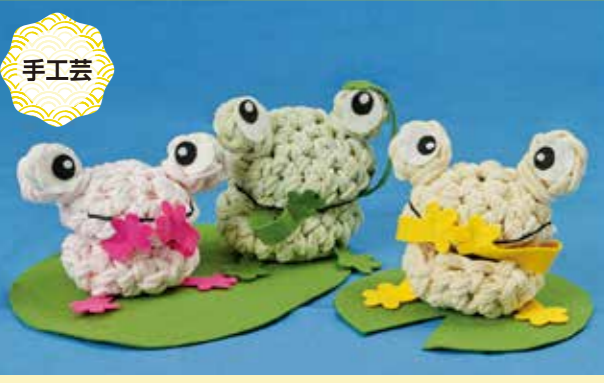
パクッとガエル(小物入れ) 大800円(高さ約15cm×幅約15cm)・小700円

●事業所 特定非営利活動法人 はなのいえ 花 〒671-2234 姫路市西脇748 TEL:080-3544-3945 Instagram:hananoiehanana