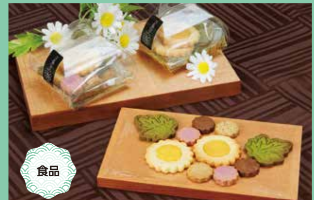
Nojigiku 500円(1セット50g) 賞味期限/製造日より40日

●事業所 特定非営利活動法人 ほほえみの花 みんなの家 〒670-0827 姫路市丸尾町100-6 親和ビル TEL:079-224-1180 Instagram:minnannoie