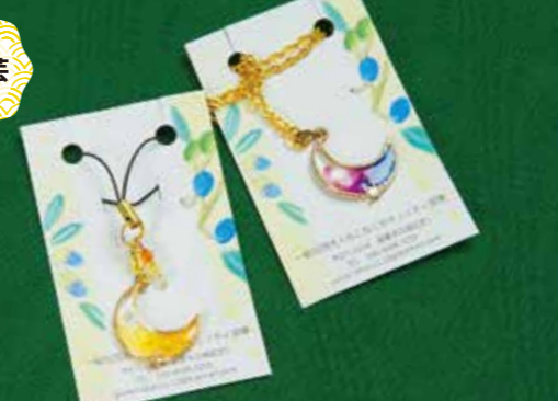
ペットとおそろいコーデ アクセサリー 800円～1,500円(縦約2cm×横約2cm×長さ約7cm)

●事業所 特定非営利活動法人 さふらん さんご 〒671-1104 姫路市広畑区才15-12 TEL:079-227-6567