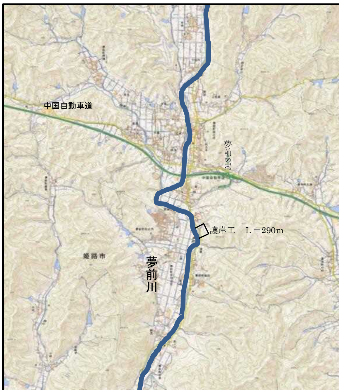
中上流部における緊急的な取組箇所 (夢前川)