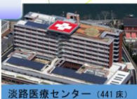
淡路医療センター (441床)