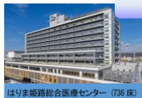
はりま姫路総合医療センター (736床)