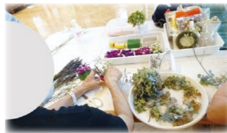
▲指先のつまみ訓練になるドライフラワーの作品作り