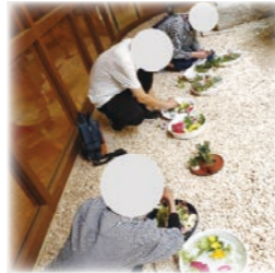
▲しゃがんで花水作り