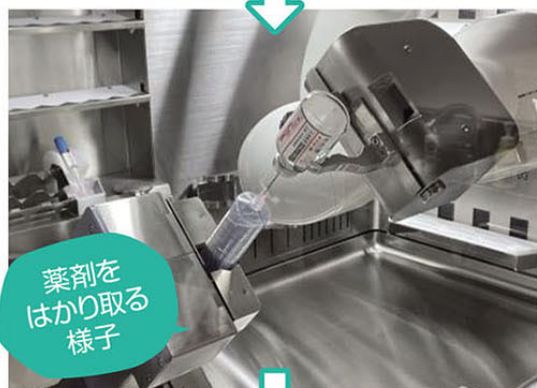
薬剤を はかり取る 様子