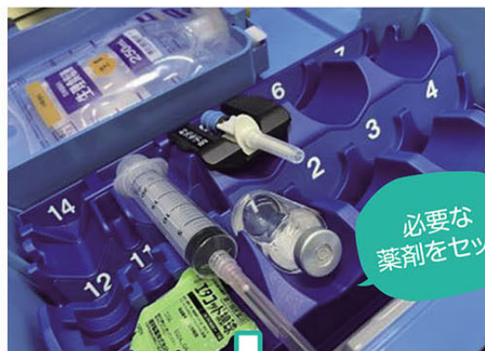
必要な 薬剤をセット