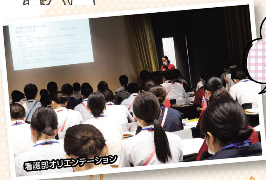
看護部オリエンテーション

新しい環境に期待と、とまどいを感じながら、看護師として、そして社会人として、一步ずつ前進しています。 研修での学びや先輩看護師からの支援を受けながら、自分が今できることを同期と共有し、取り組んでいきます。 今後も先輩看護師と共に、患者さんを笑顔にできる看護師を目指していきます。