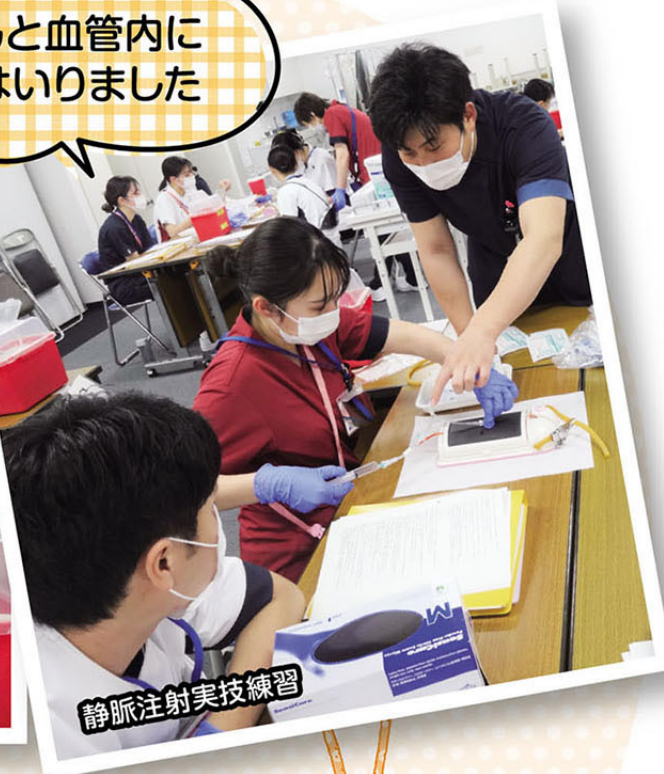
静脈注射実技練習