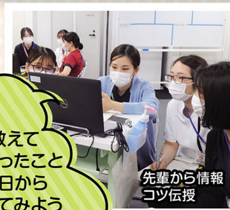
先輩から情報 コツ伝授