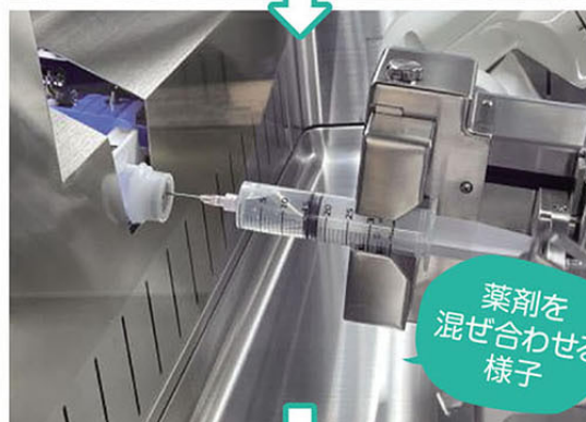
薬剤を 混ぜ合わせる 様子