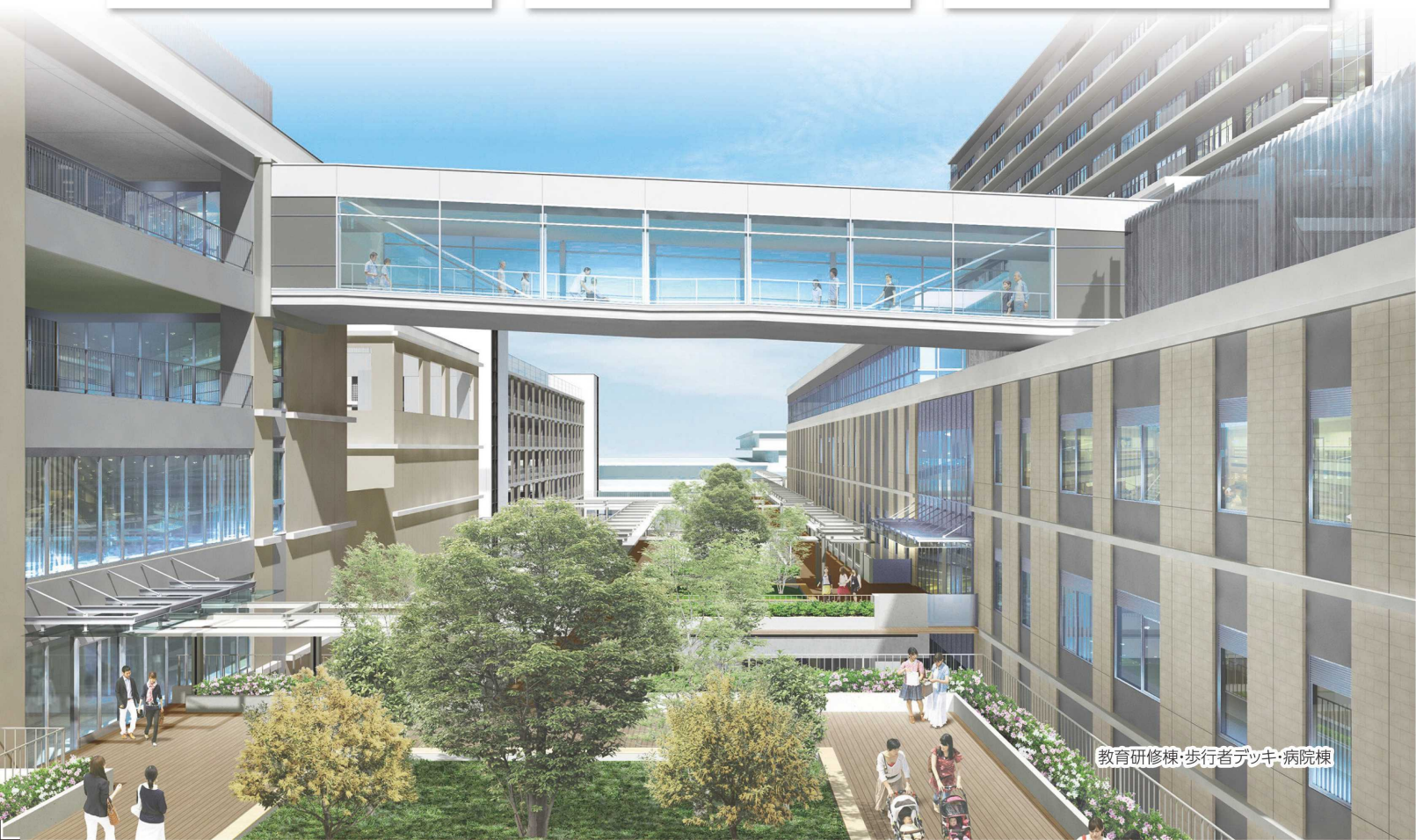
教育研修棟・歩行者デッキ・病院棟

〒671-1122 姫路市広畑区夢前町3丁目1番地 TEL(079)236-1038(代表) FAX(079)236-8570