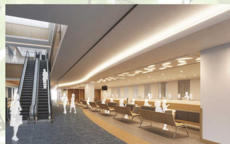
メディカルモール(総合受付)