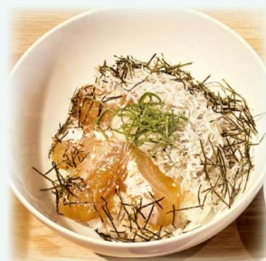
▲淡路島のしらすを使った料理(イメージ)