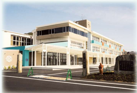
▲廃校となった小学校をリノベーションした「さの小テラス」