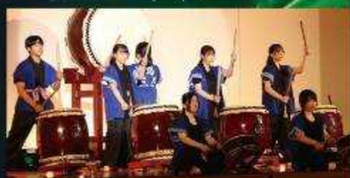
淡路三原高等学校 和太鼓部