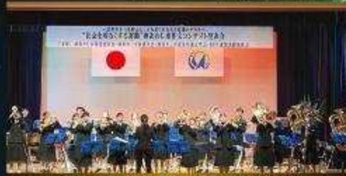
三原中学校 吹奏楽部