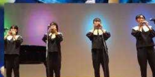
プルチーナ・クロワッサンス