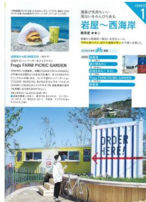
おてがるAWAJISHIMAサイクリングブック (洲本土木事務所・淡路島観光協会)