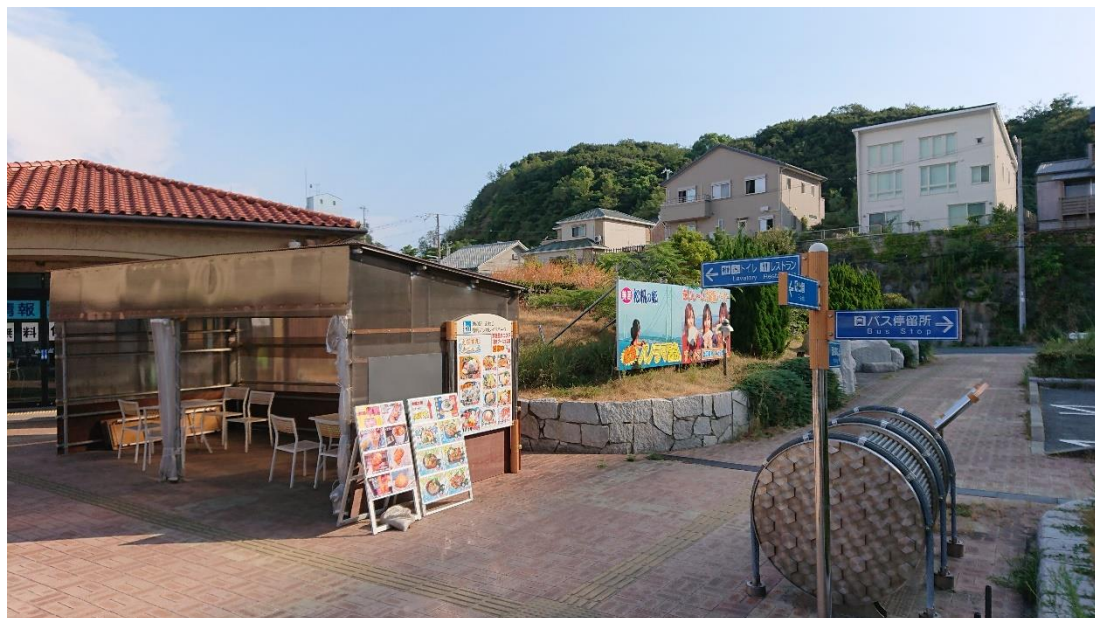
道の駅あわじ ラック設置予定箇所

サイクルラックの整備（道の駅あわじ 他） 岩屋ポートビルリニューアル（施工開始） （仮称）道の駅高田屋嘉兵衛 整備予定 道の駅うずしおリニューアル 基本計画