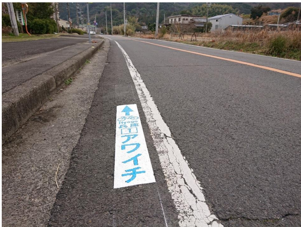
路面表示タイプ整備状況 (洲本市小路谷、県道洲本灘賀集線)