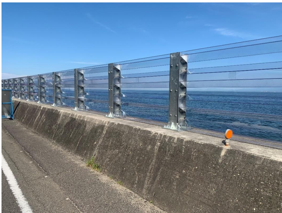
越波対策 (国道28号 淡路市釜口) (R3.7撮影)