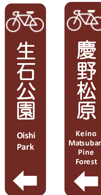
標識レイアウト (主要観光地)