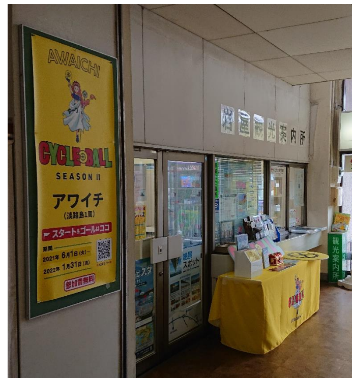
サイクルボールスタート地点 (岩屋観光案内所)