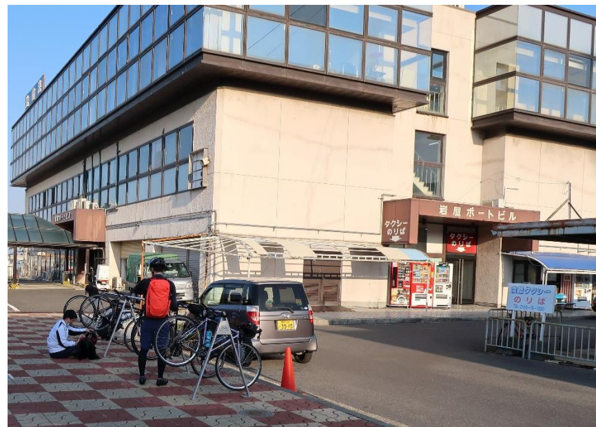
現在の岩屋ポートビル