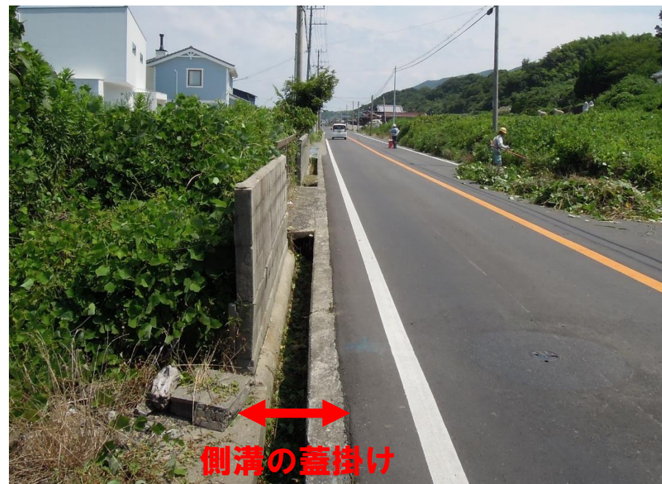
側溝蓋掛け予定(洲本市五色町都志) (R3.7撮影)