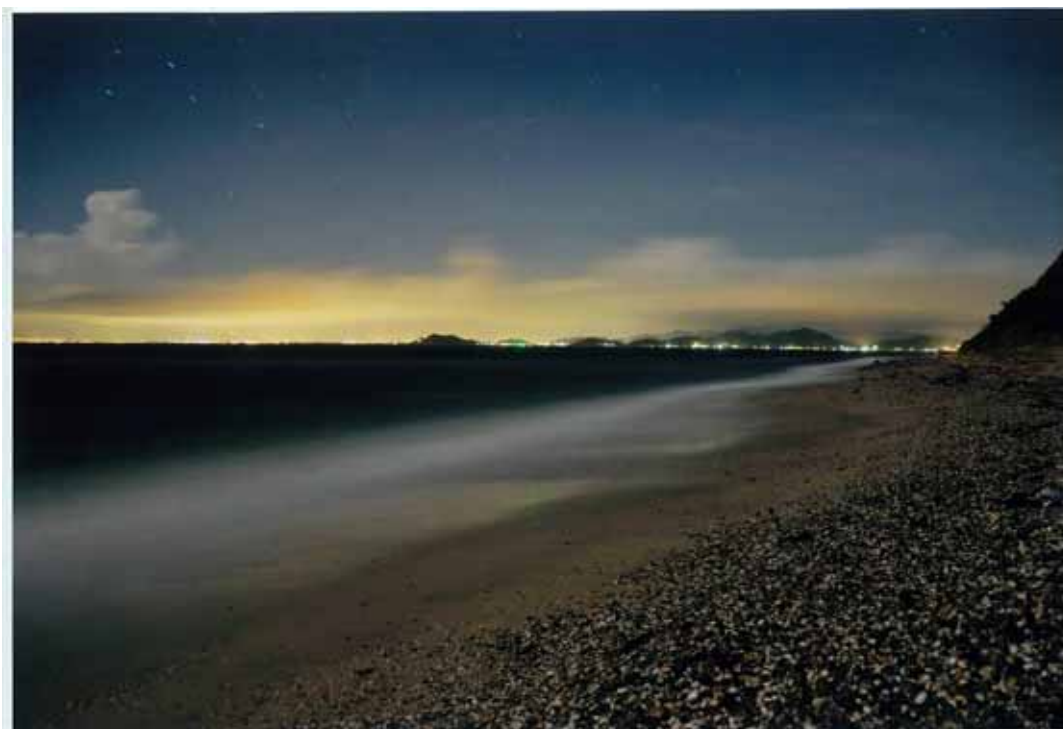
「波音の浜辺」南あわじ市 (第1回淡路島景観フォトコンテスト応募作品)